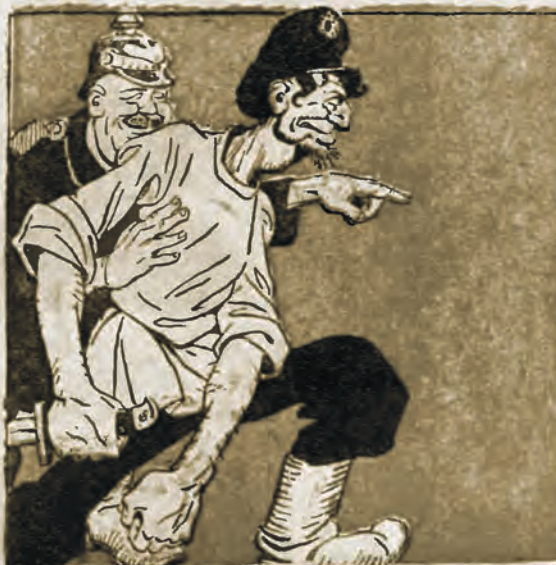
Niemiec stworzył bolszewika, aby mordował i niszczył Europę.