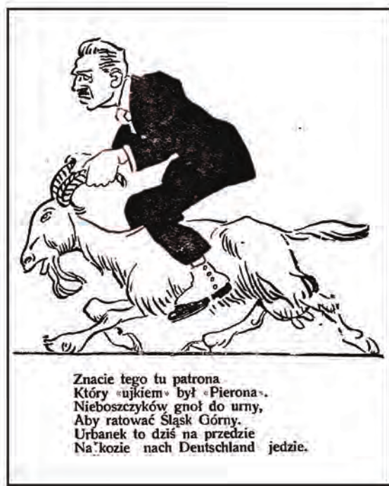
„Kocynder” 1922, nr 14 [z 20 VI - 1 VII]