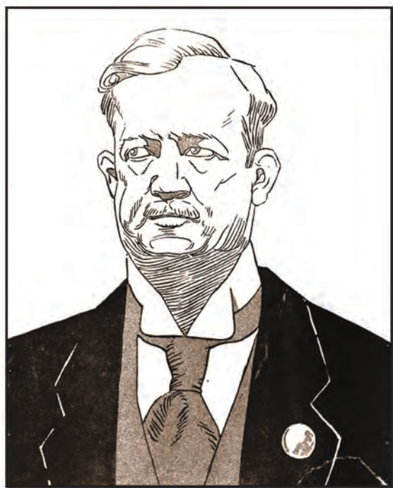
„Górny Śląsk” - dodatek plebiscytowy do „Kocyndra” z 1921 r.