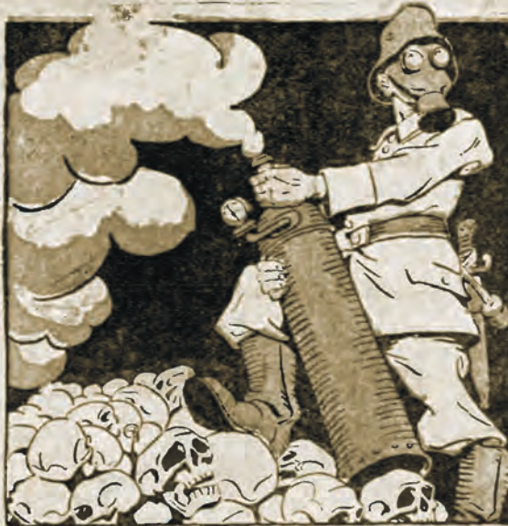
Niemiec wynalazł gazy trujące, do zabijania ludzi.