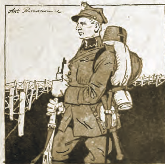
Żołnierz polski pokonał bolszewika, aby uchronić Europę od nieszczęścia i teraz strzeże jej het na wschodnich granicach Polski.