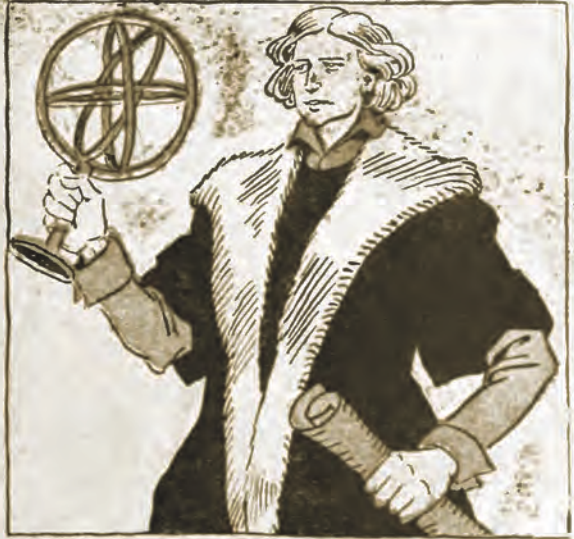
Ksiądz polski i sławny astronom Kopernik odkrył prawdę, że ziemia koło słońca, a nie słońce koło ziemi się obraca i przez naukę dążył do braterstwa ludzi.