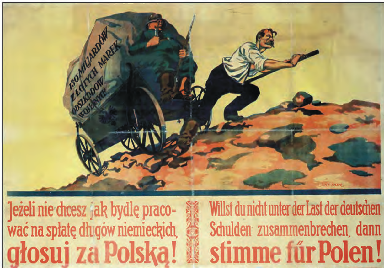
Polski plakat plebiscytowy.