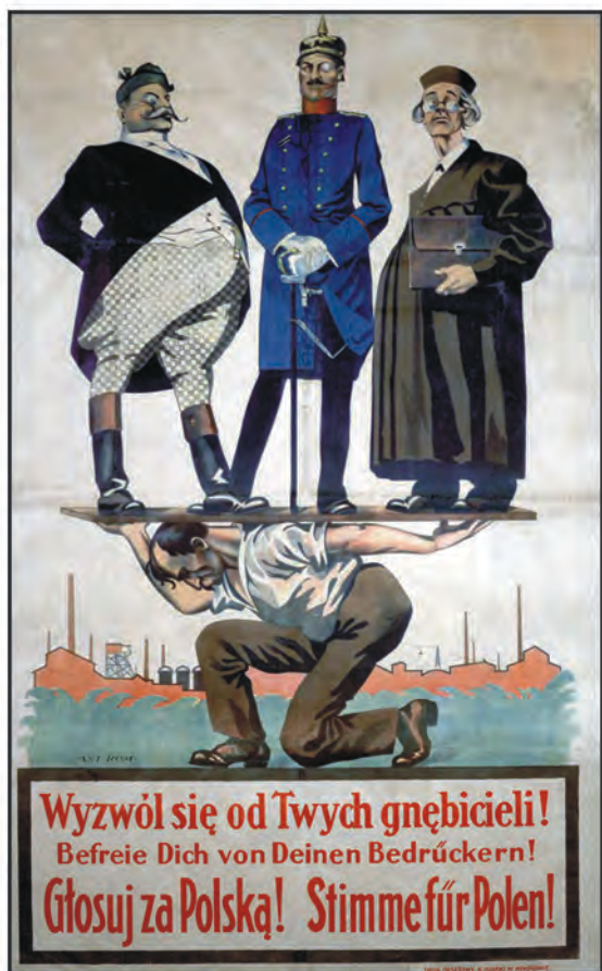
„Kocynder” 1920, nr 13 [z 20 XI]