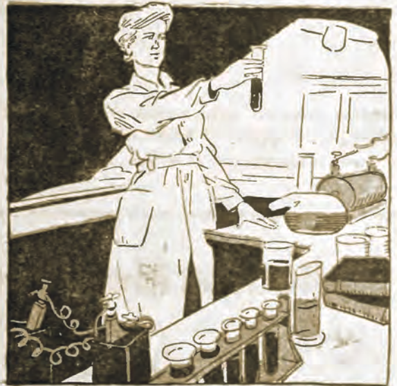
Polka p. Skłodowska wynalazła „radium“, aby uzdrawiać ludzi.