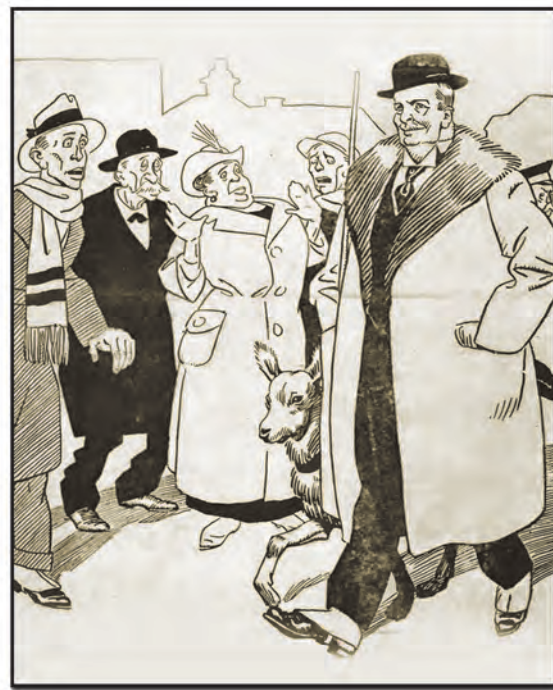
„Kocynder” 1920, nr 13 [z 20 XI]