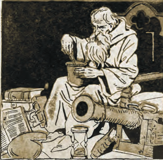
Zakonnik niemiecki: Schwarz wynalazł proch do mordowania ludzi.