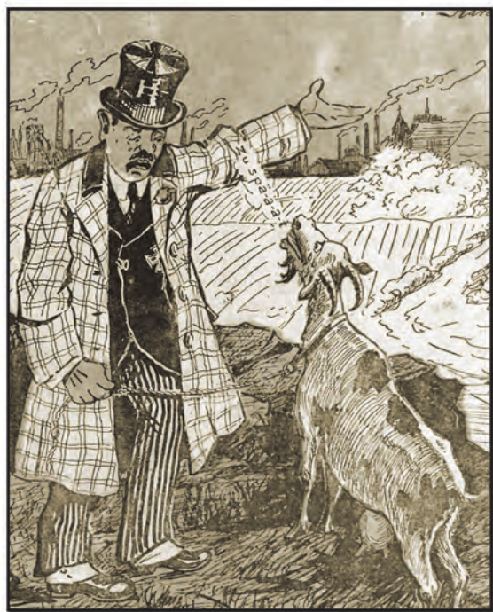
„Kocynder” 1922, nr 53 [z 20 II]