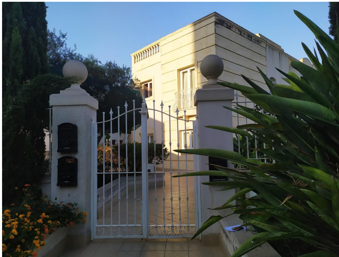
Hostel w pobliżu centrum St Julian's. Hostel near St Julian's center.