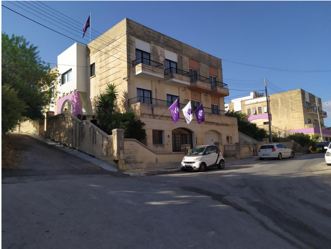
Szkoła językowa na Malcie. Language school in Malta.