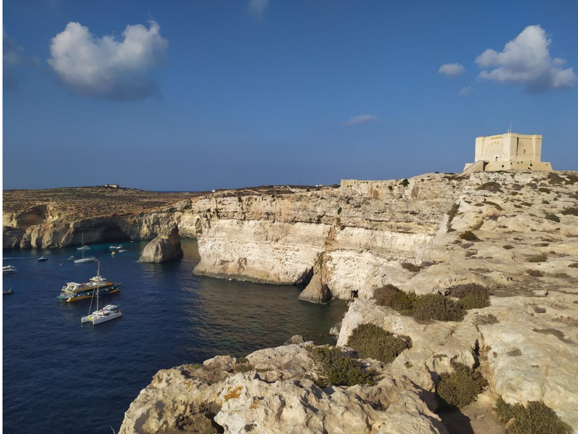
W pobliżu Błękitnej Zatoki. Near the Blue Bay.