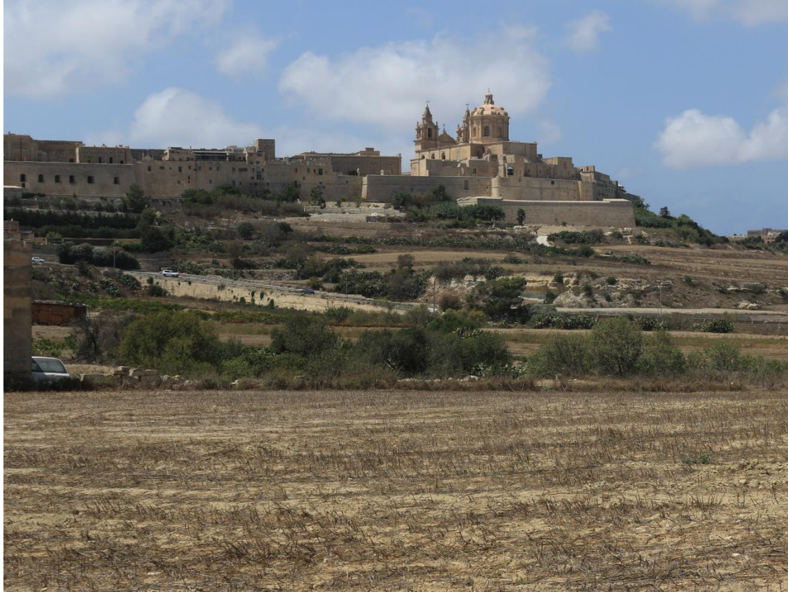
Zabytki. Mdina – stare miasto. Historical monuments. Mdina - the old town.