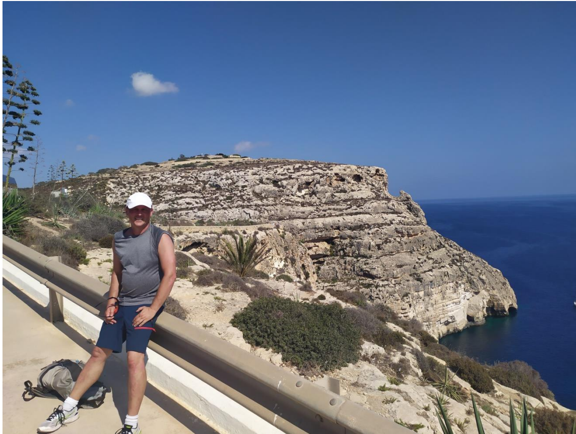
Na szlaku. On the trail.