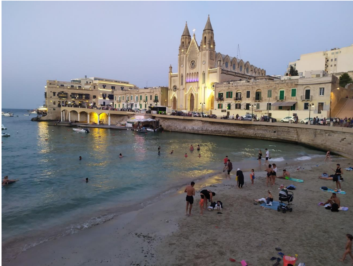
Sliema, kościół przy zatoce. Sliema, the church by the bay.