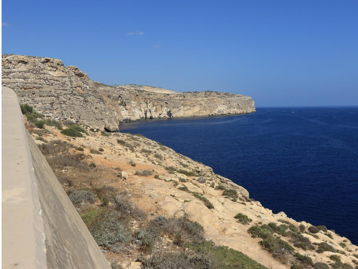
Nadmorski krajobraz i wysokie klify. Seaside landscape and high cliffs.