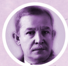
Wojciech Korfanty czyli główny bohater naszej historii