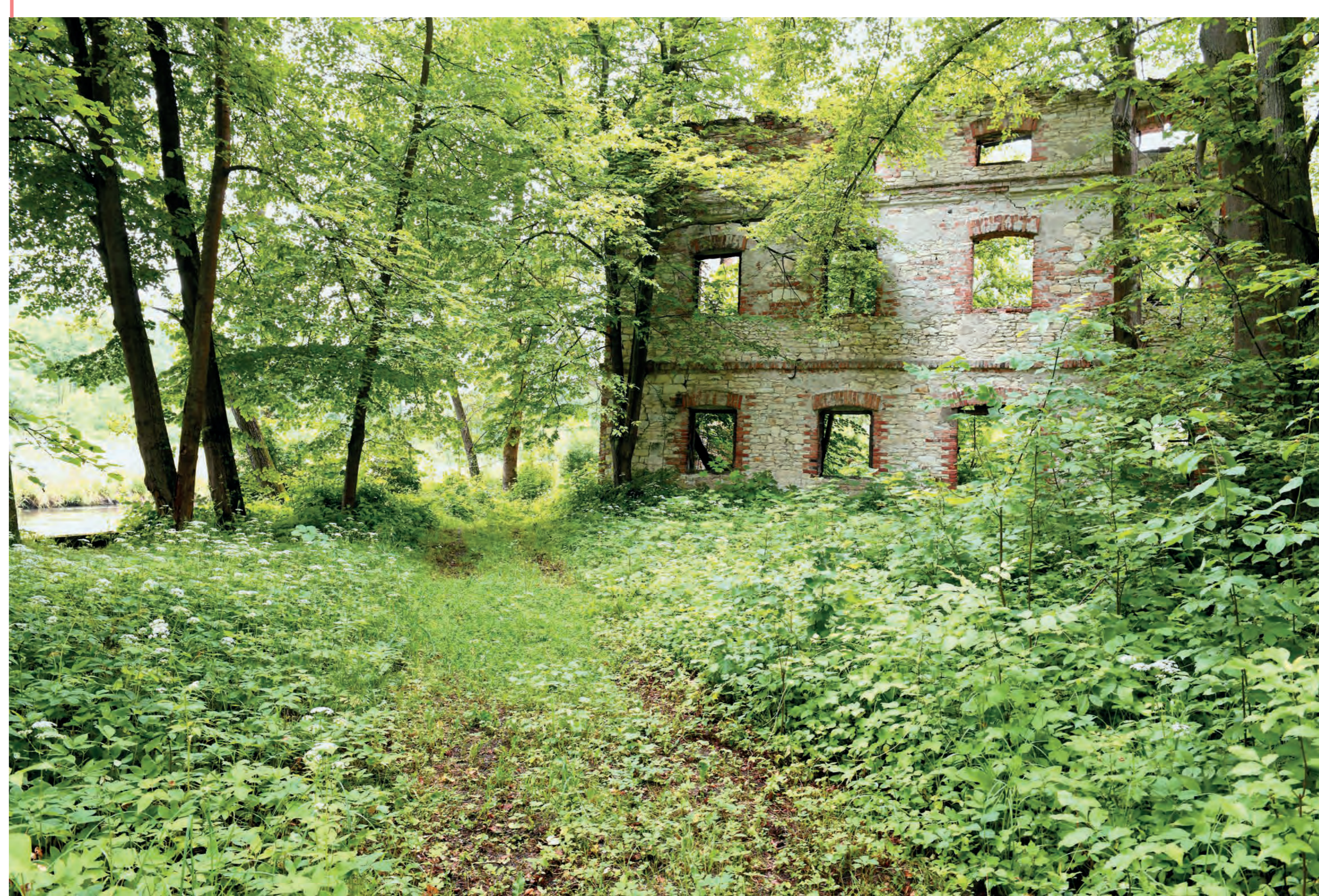
Ruiny młyna wodnego. Przyłęk Szlachecki. 2023 r.