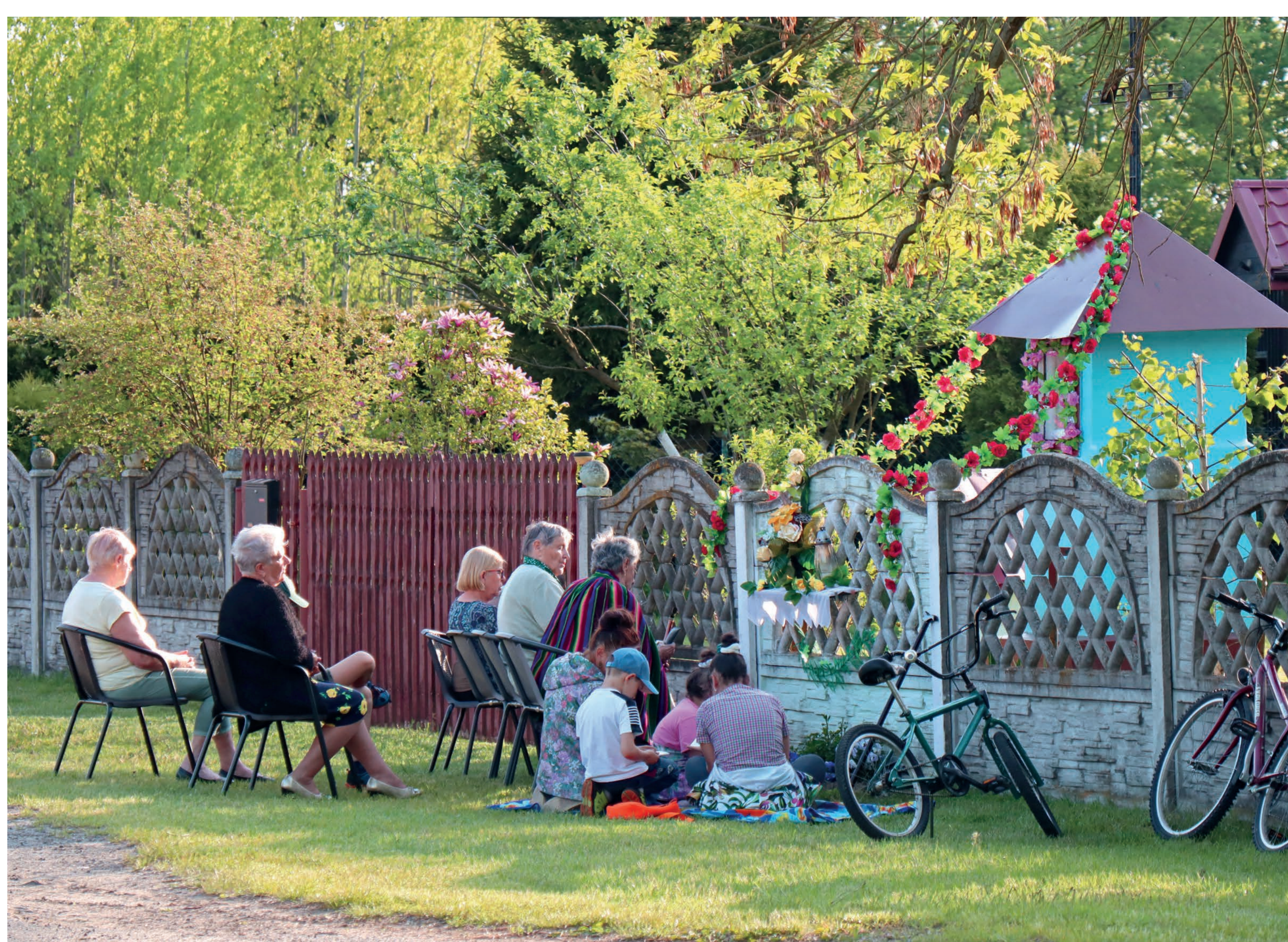
Nabożeństwo majowe. Nowa Wieś. 2022 r.