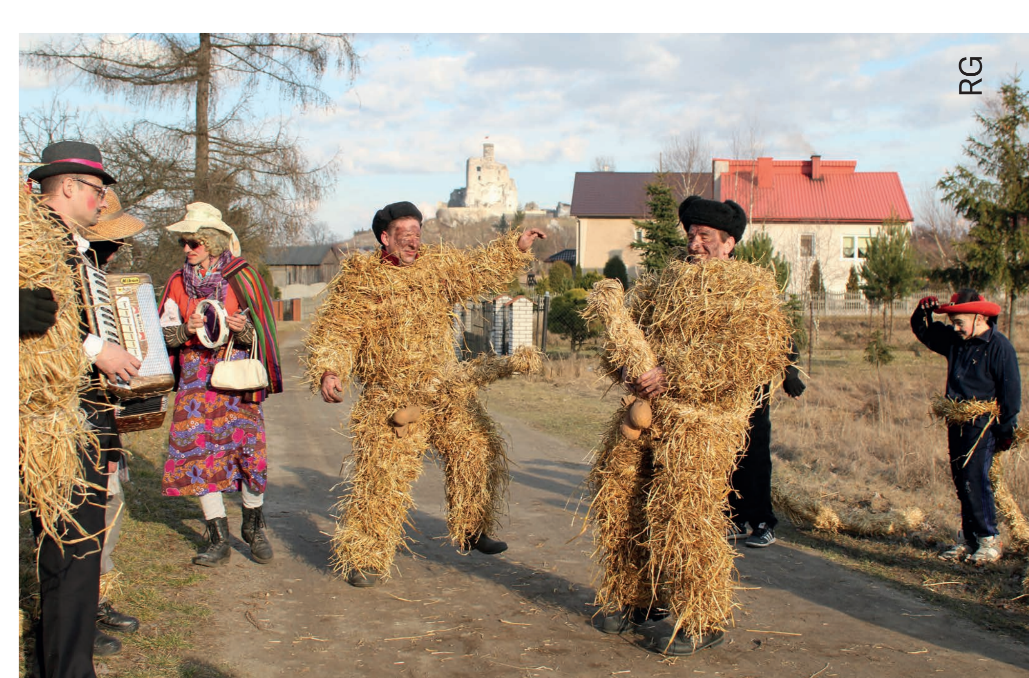
Tańczące misie. Mirów. 2014 r.