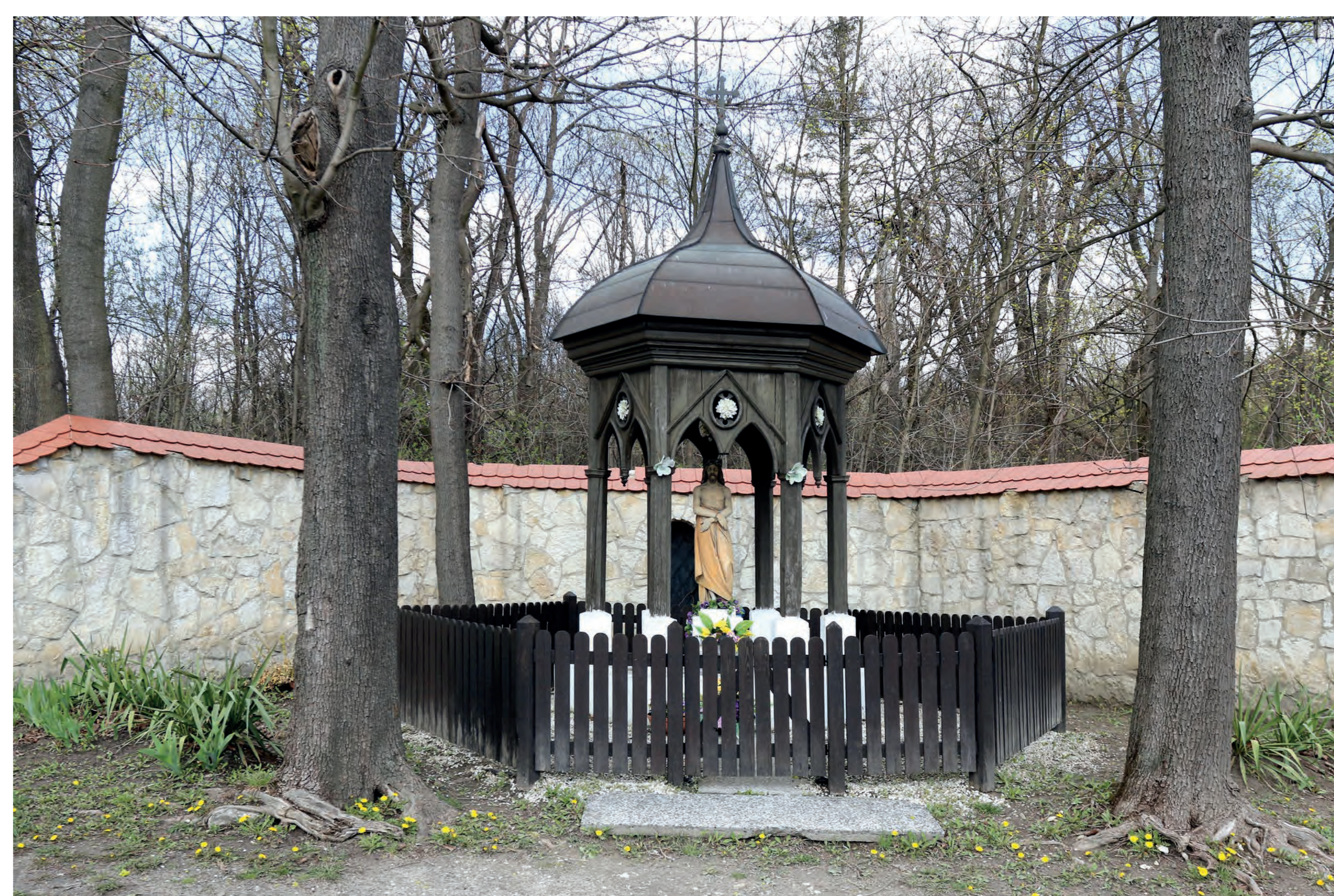
Kapliczka z figurą Chrystusa obnażonego. Małusy Wielkie. 2022 r.