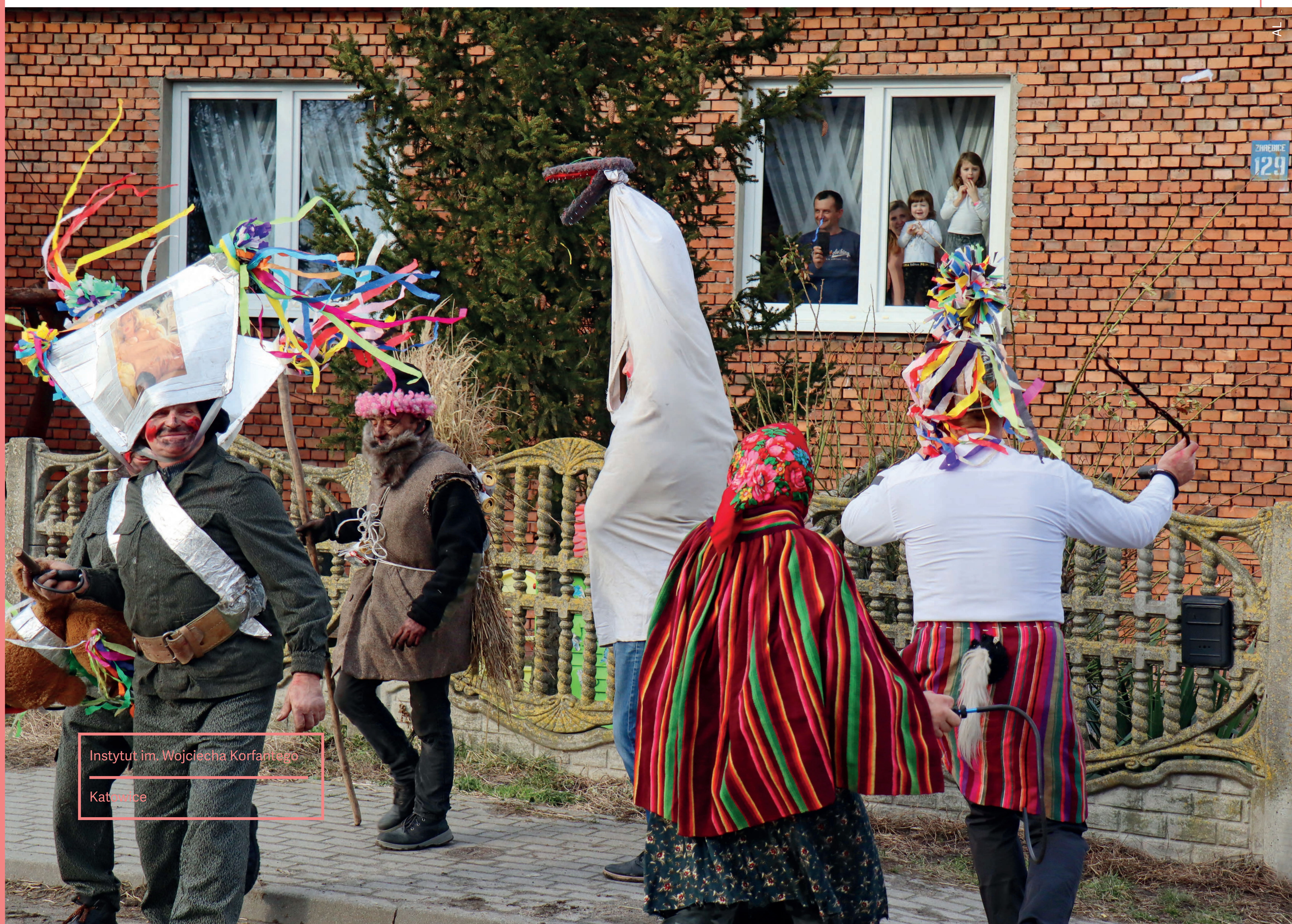
Występ pod oknami. Zarębice. 2023 r.

Institut im. Wojciecha Korfańskiego Katowice