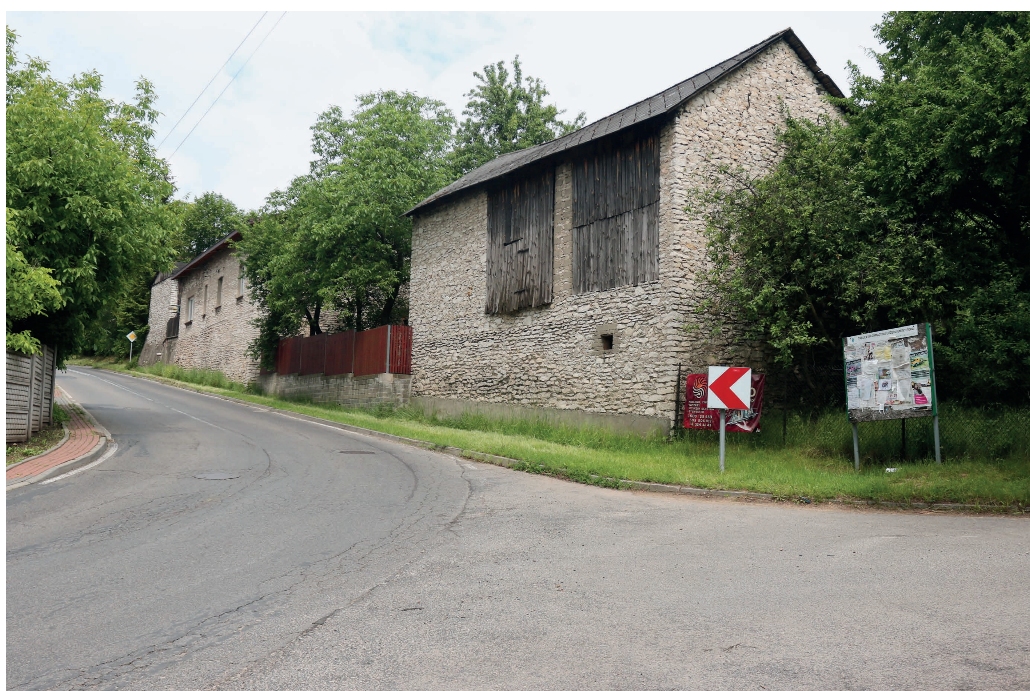
Pozostałości zespołu stodoł. Mstów. 2022 r.