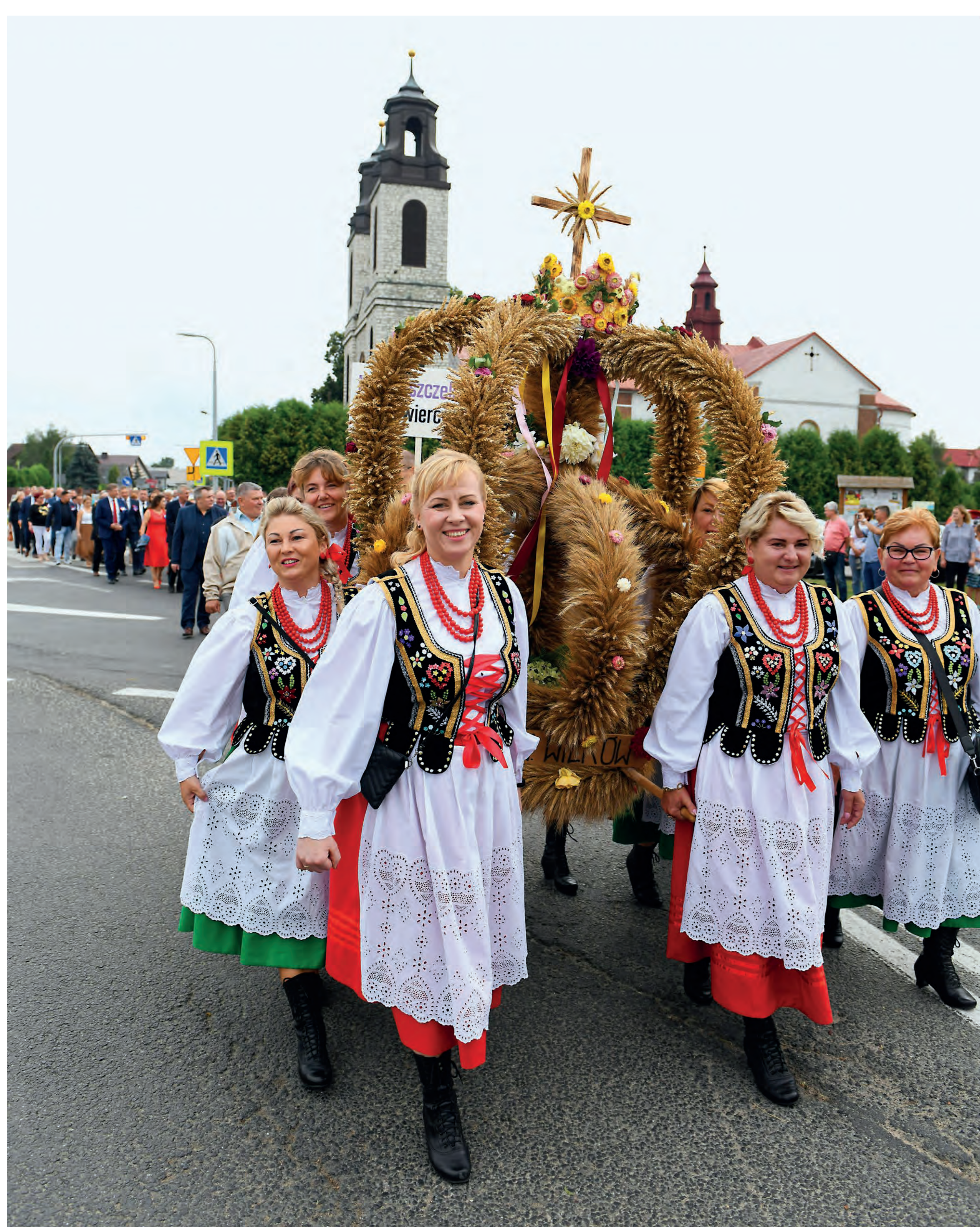
Członkinie KGW Wilków (gm. Irządze) niosące koronę dożynkową podczas dożynek powiatowych. Kroczyce. 2022 r.