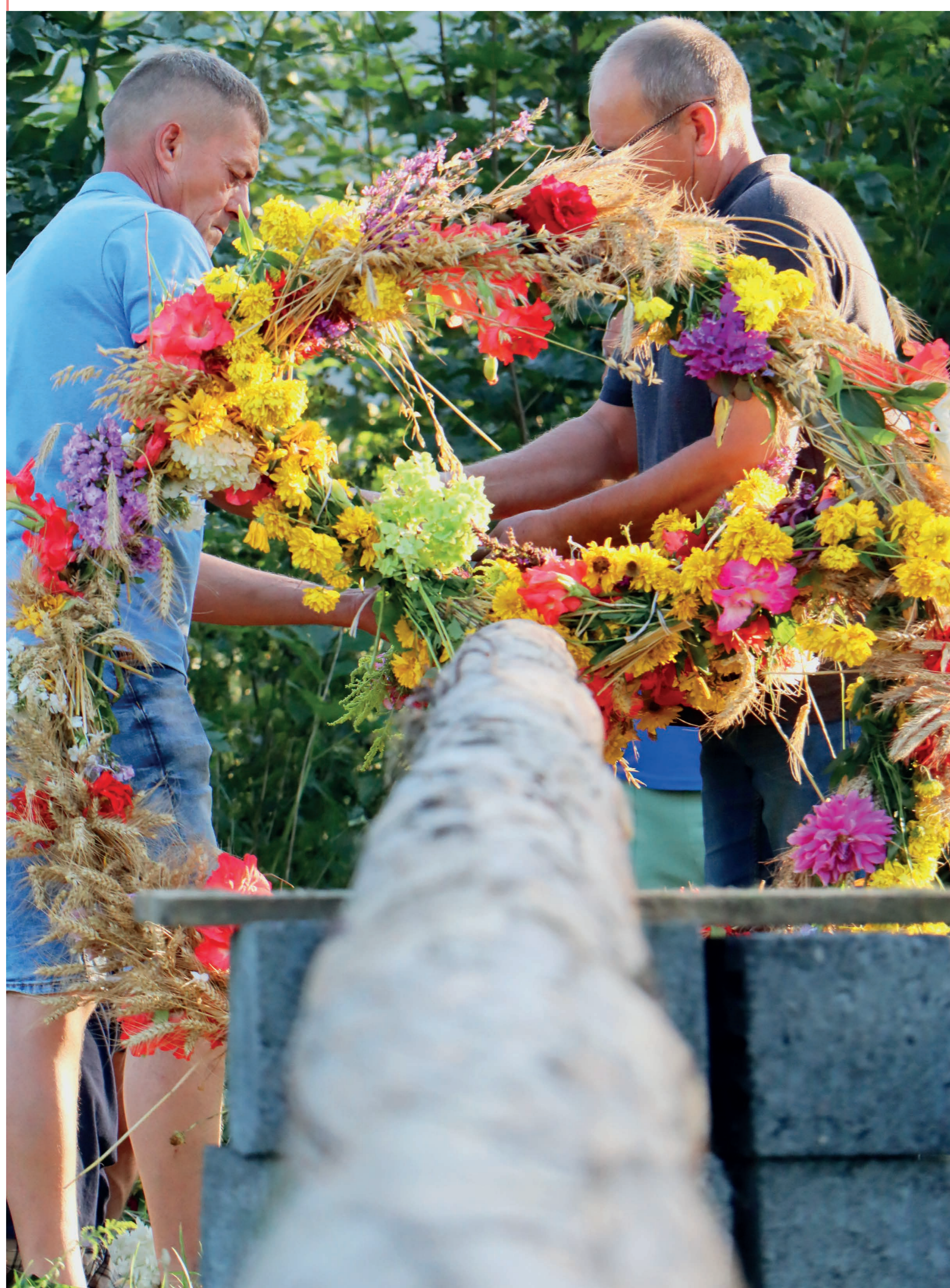
Strojenie ziela. Ślężany. 2023 r.