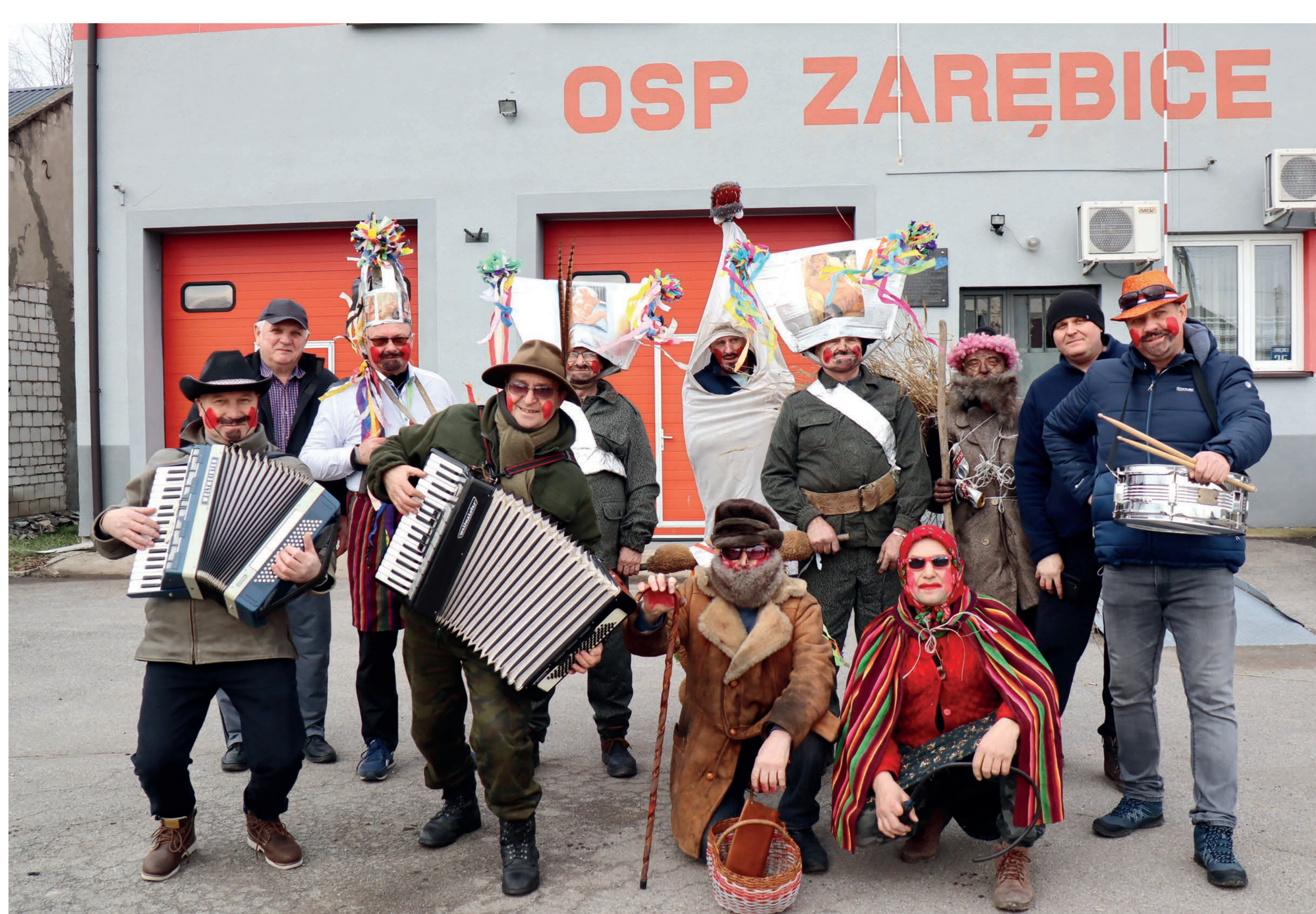
Misinki – grupa w pełnym składzie. Zarębice. 2023 r.