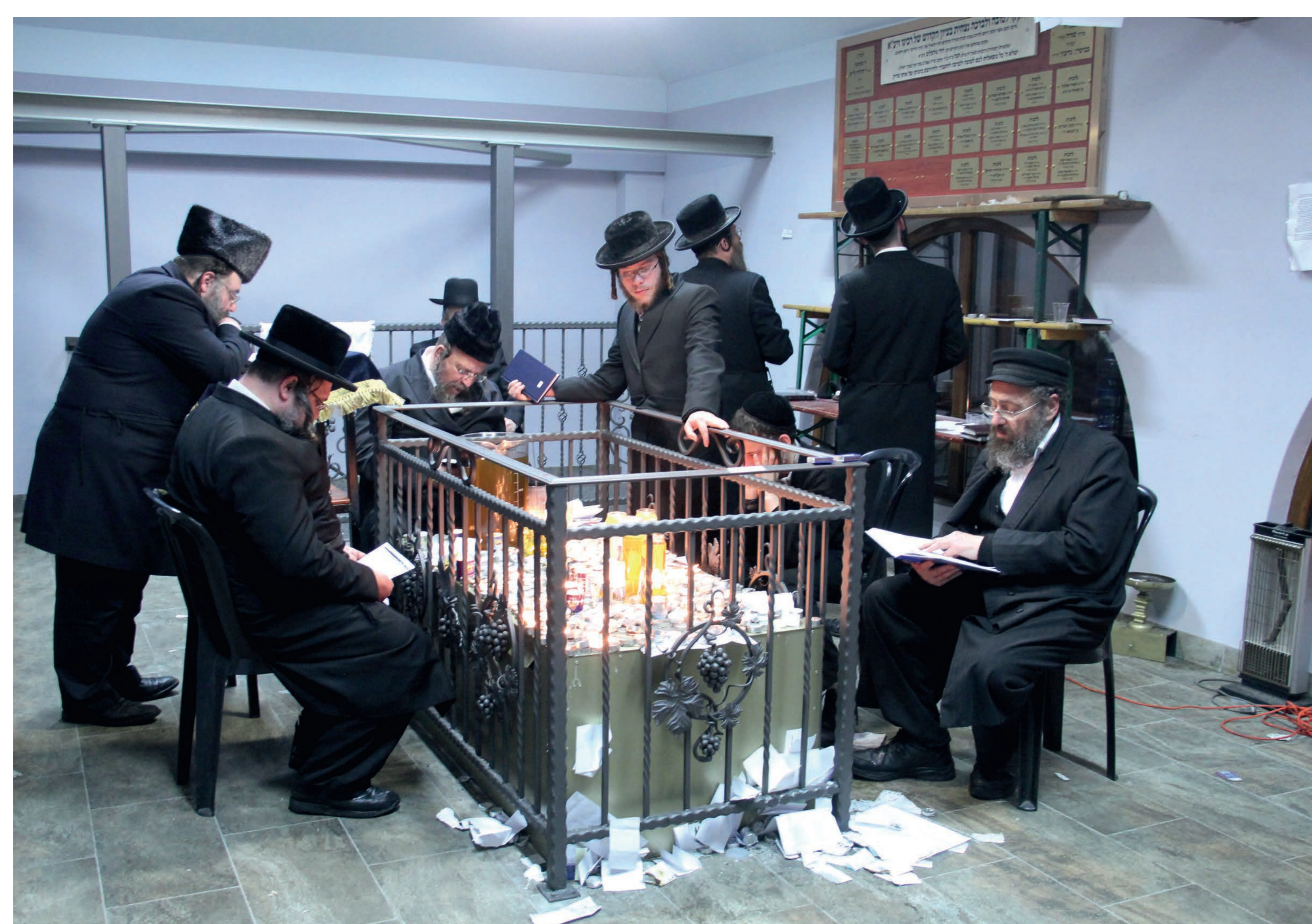
Chasydzi modlący się przy grobie cadyka. Lelów. 2015 r.