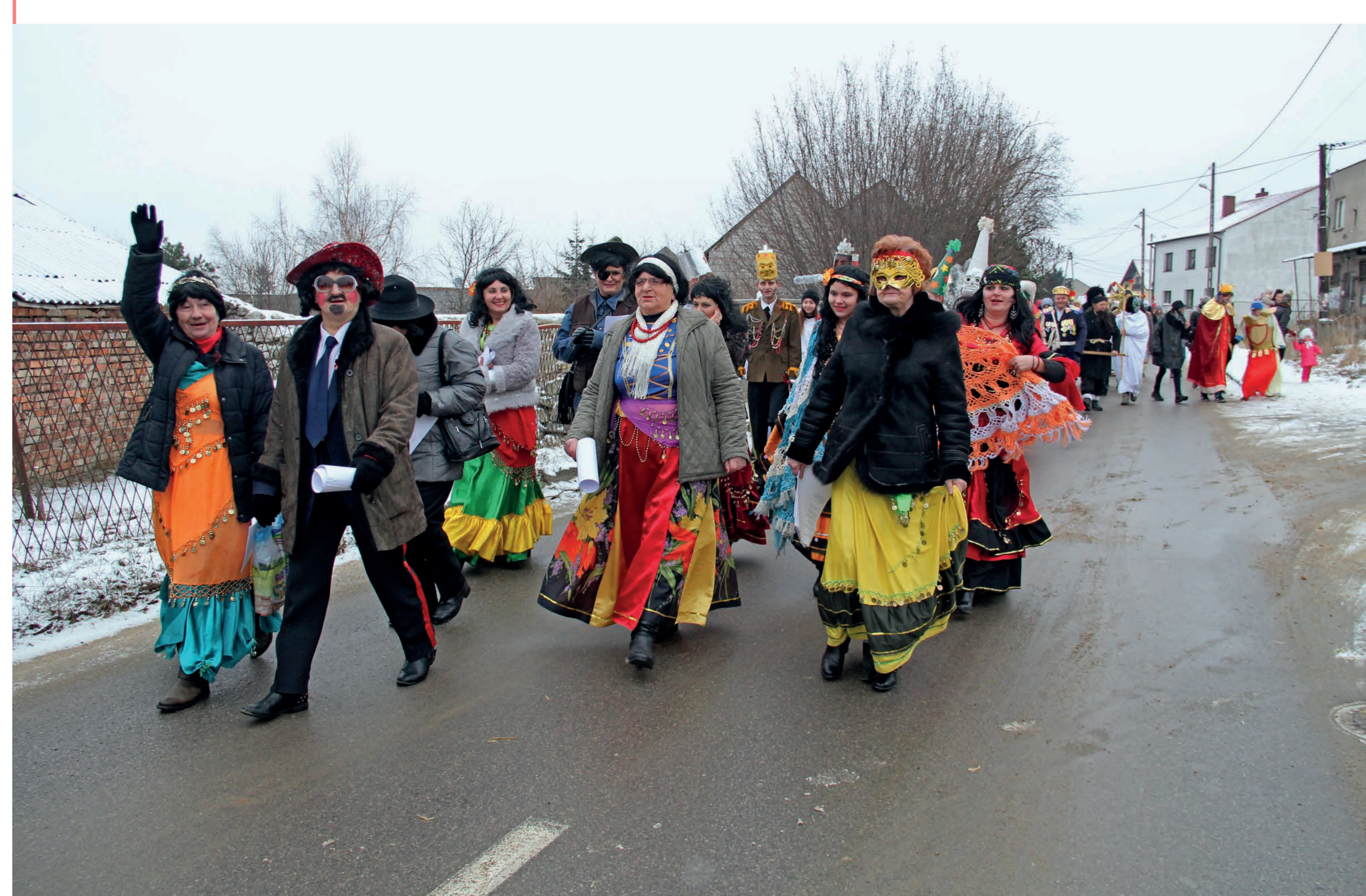
Grupa ostatekowa. Rudnik Wielki. 2015 r.