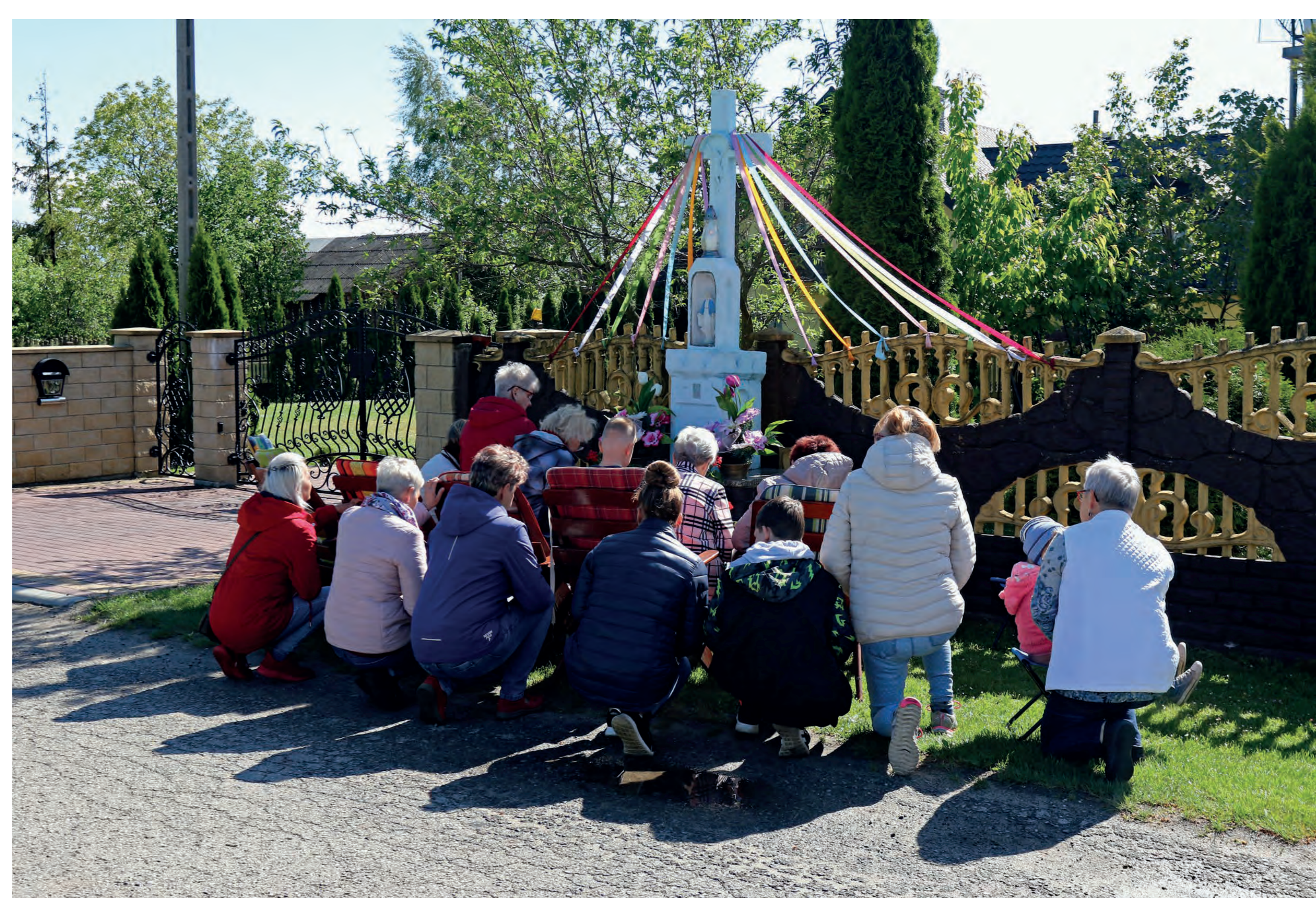
Nabożeństwo majowe. Gulzów. 2022 r.