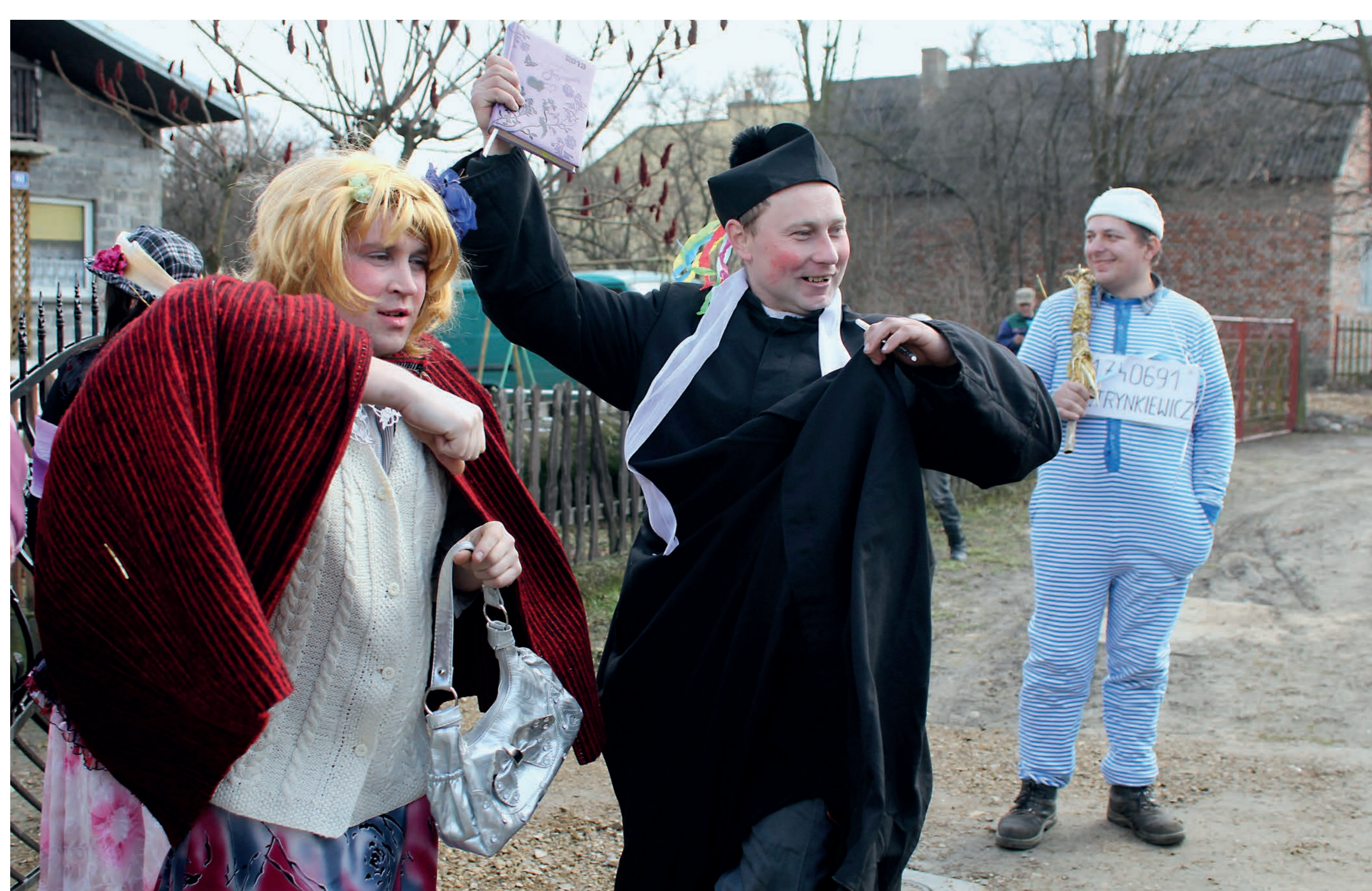
Babka w zapasce naramiennej. Grupa ostatkowa. Trzebnów. 2014 r.