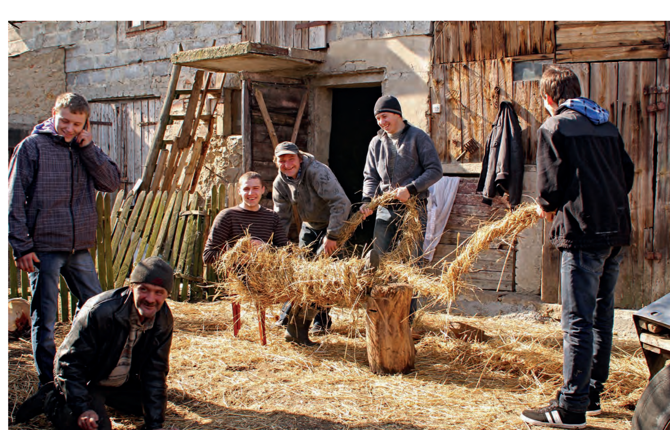
Kręcenie warkoczy potrzebnych do kostiumu misia. Łutowiec. 2014 r.