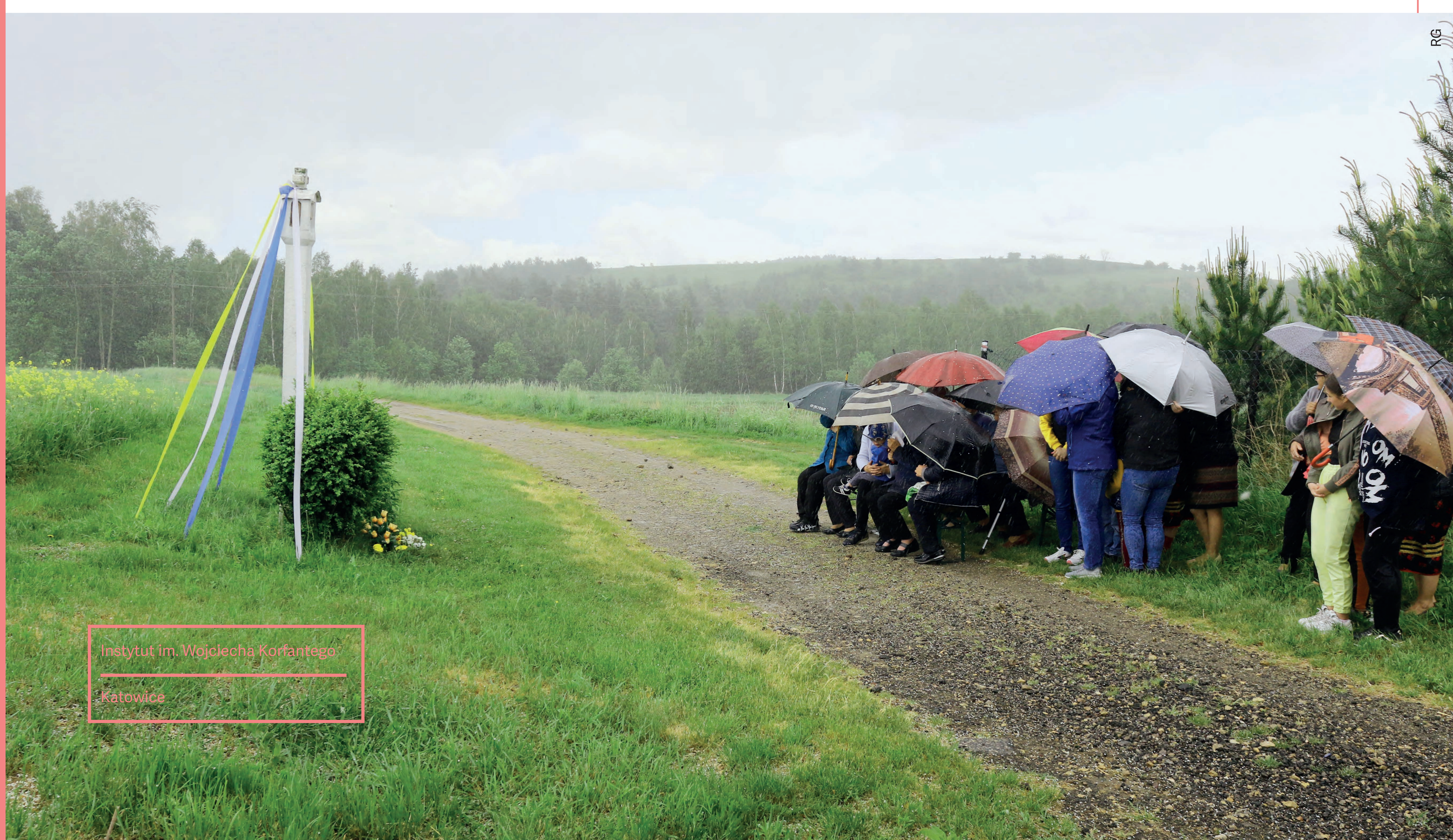
Instytut im. Wojciecha Korfańskiego Katowice