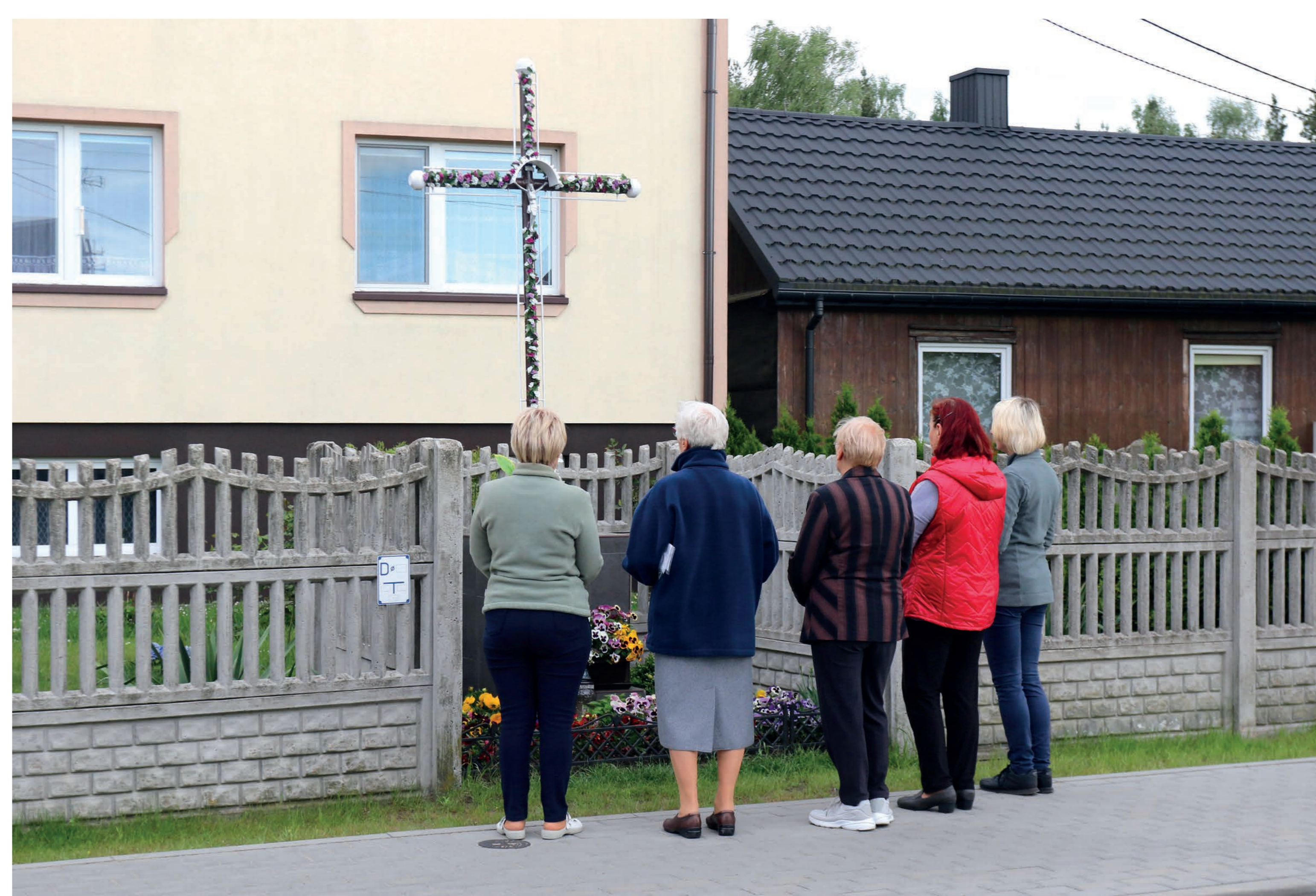
Nabożeństwo majowe. Kusięta. 2022 r.