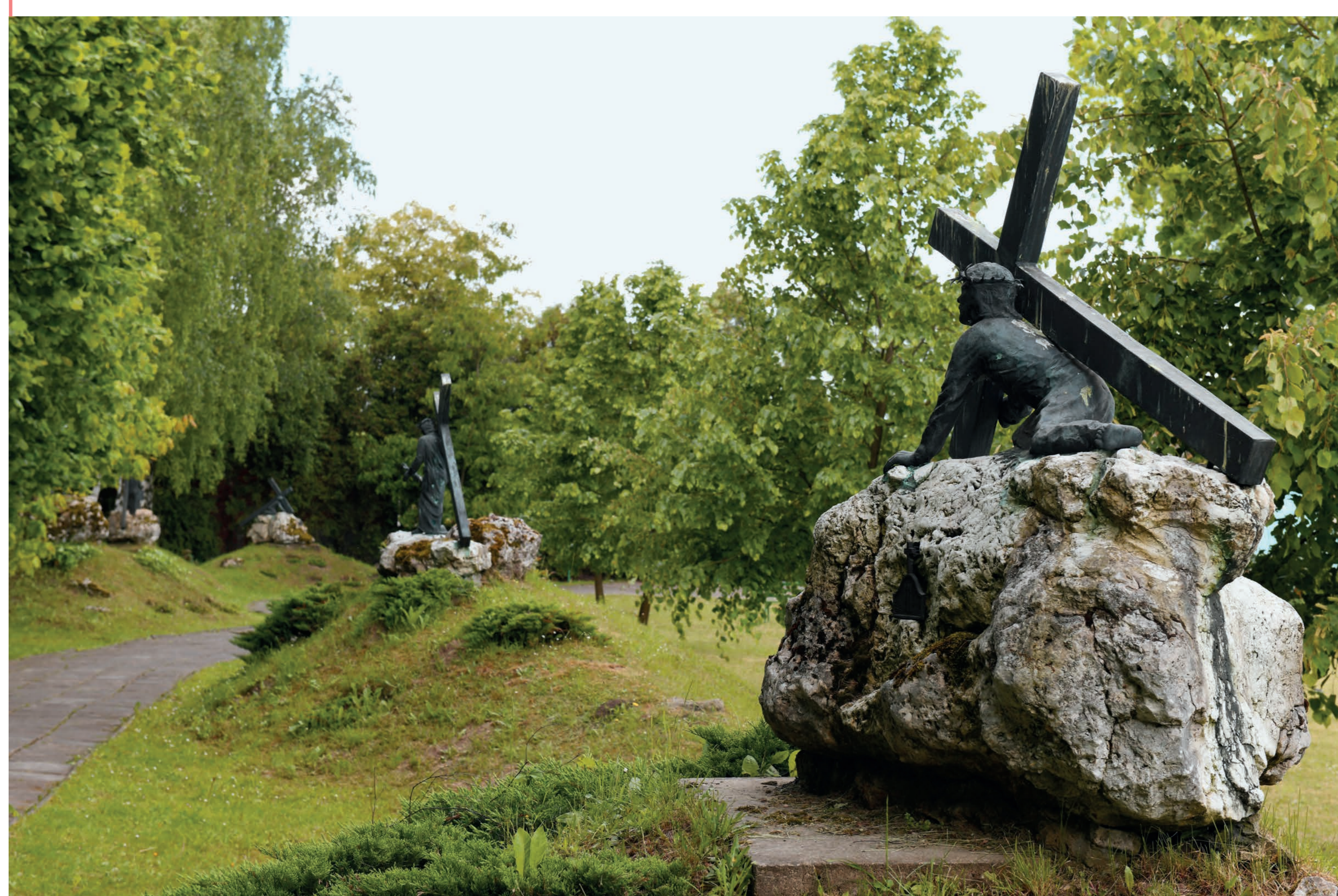
Stacje drogi krzyżowej. Myszków Mrzygód. 2023 r.