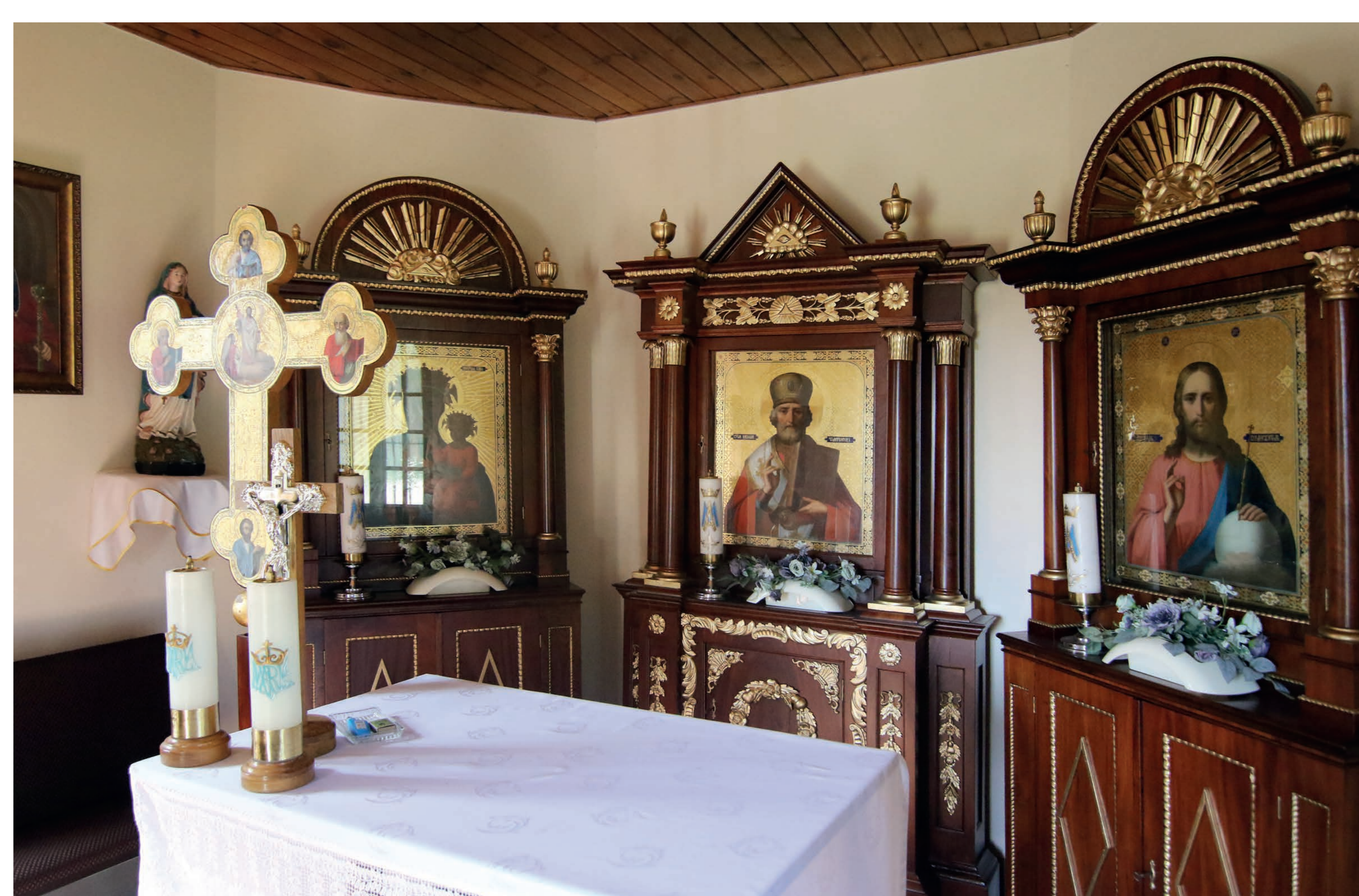
Wnętrze cerkiewki. Podłęże Królewskie. 2022 r.