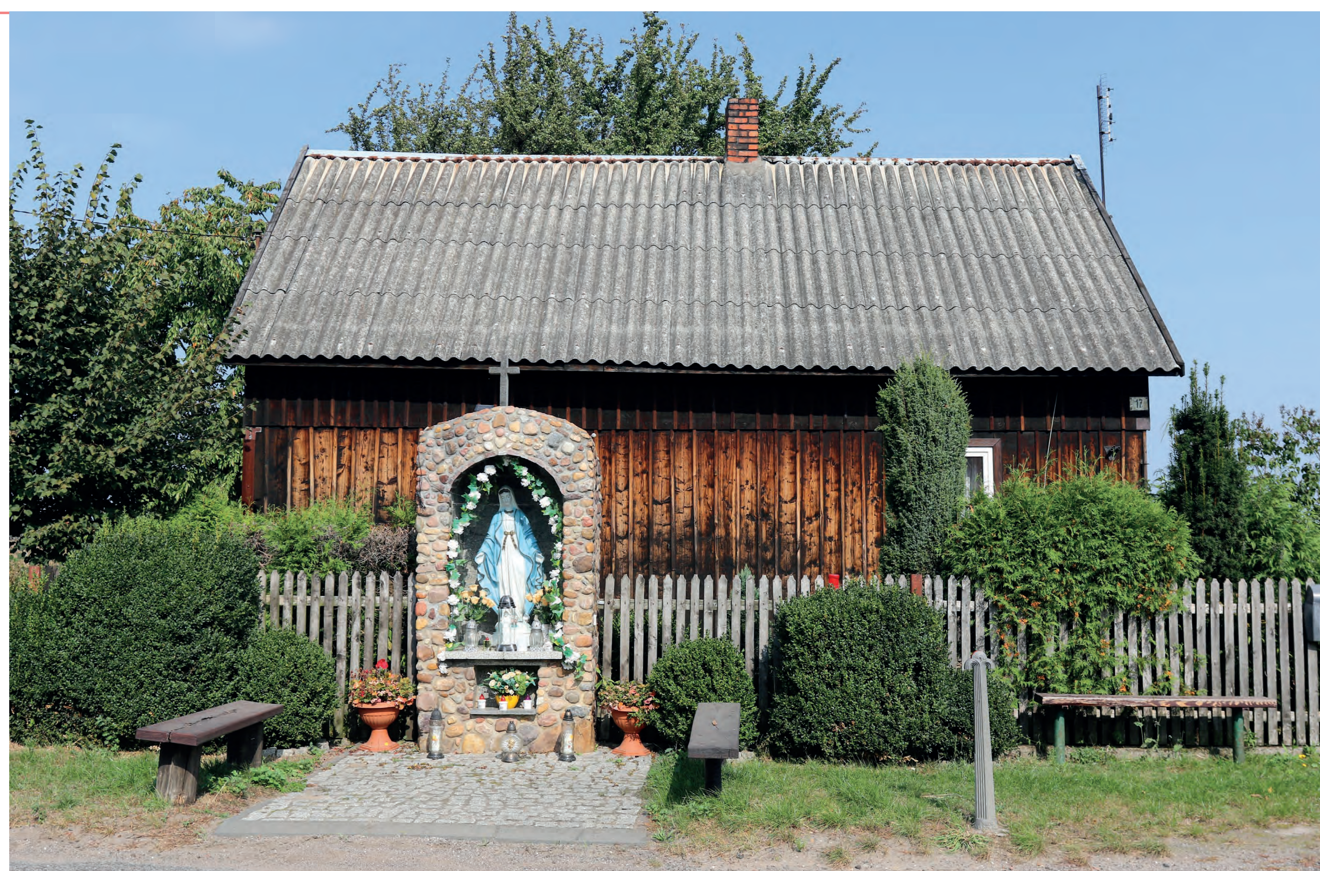
Kapliczka. Napoleon. 2022 r.