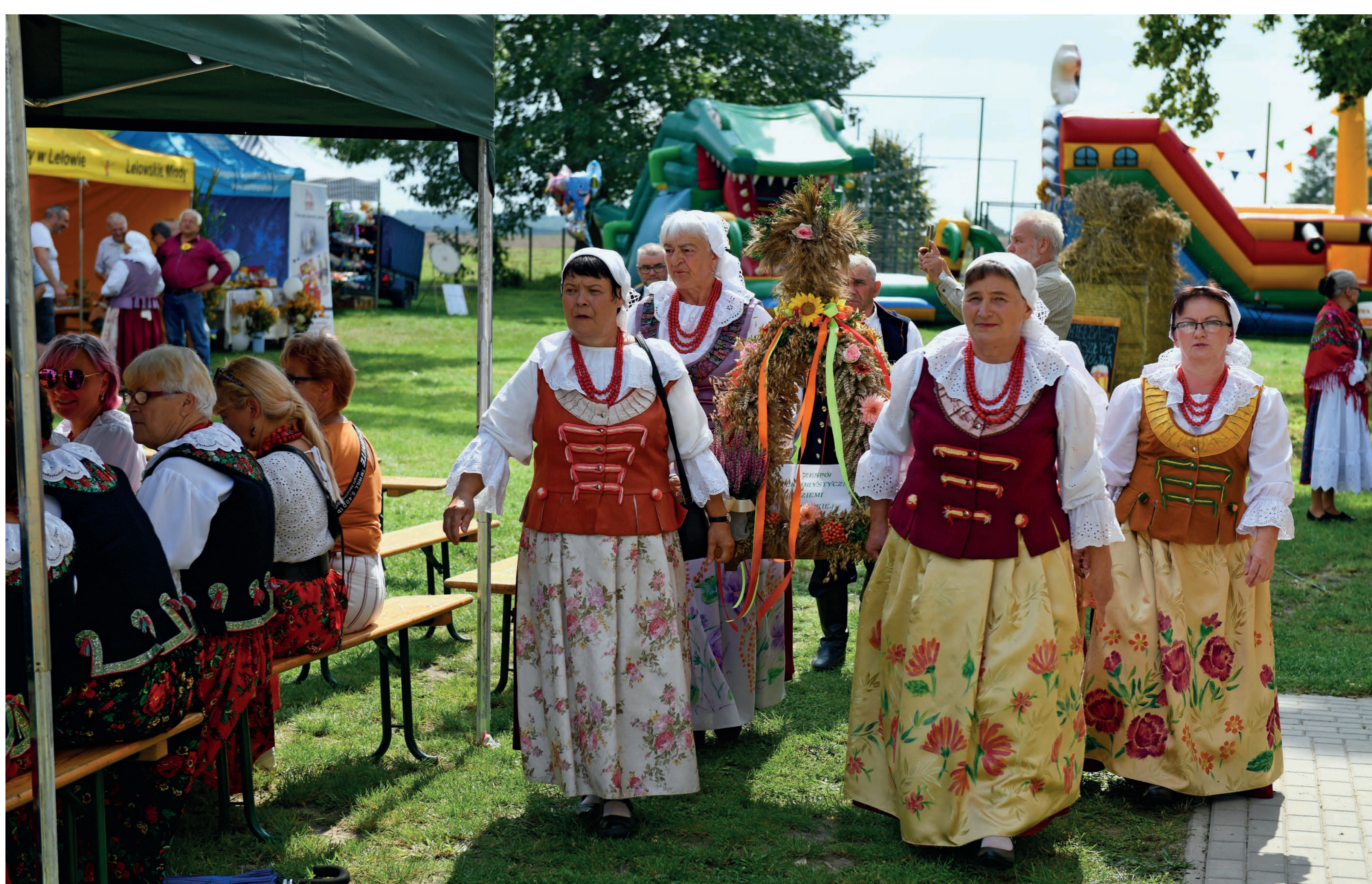
Kobiety z zespołu folklorystycznego z koroną dożynkową, w kostiumach nawiązujących do śląskich strojów. Podlesie (gm. Lelów). 2022 r.