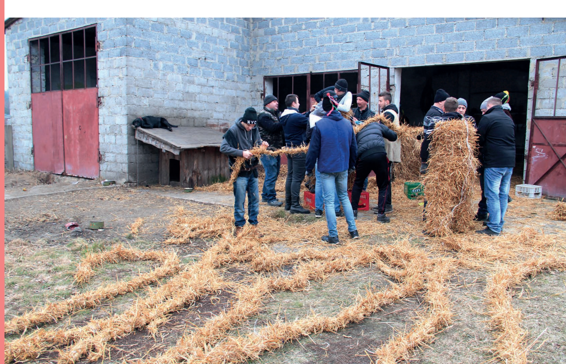
Tworzenie kostiumu misia. Niegowa. 2019 r.