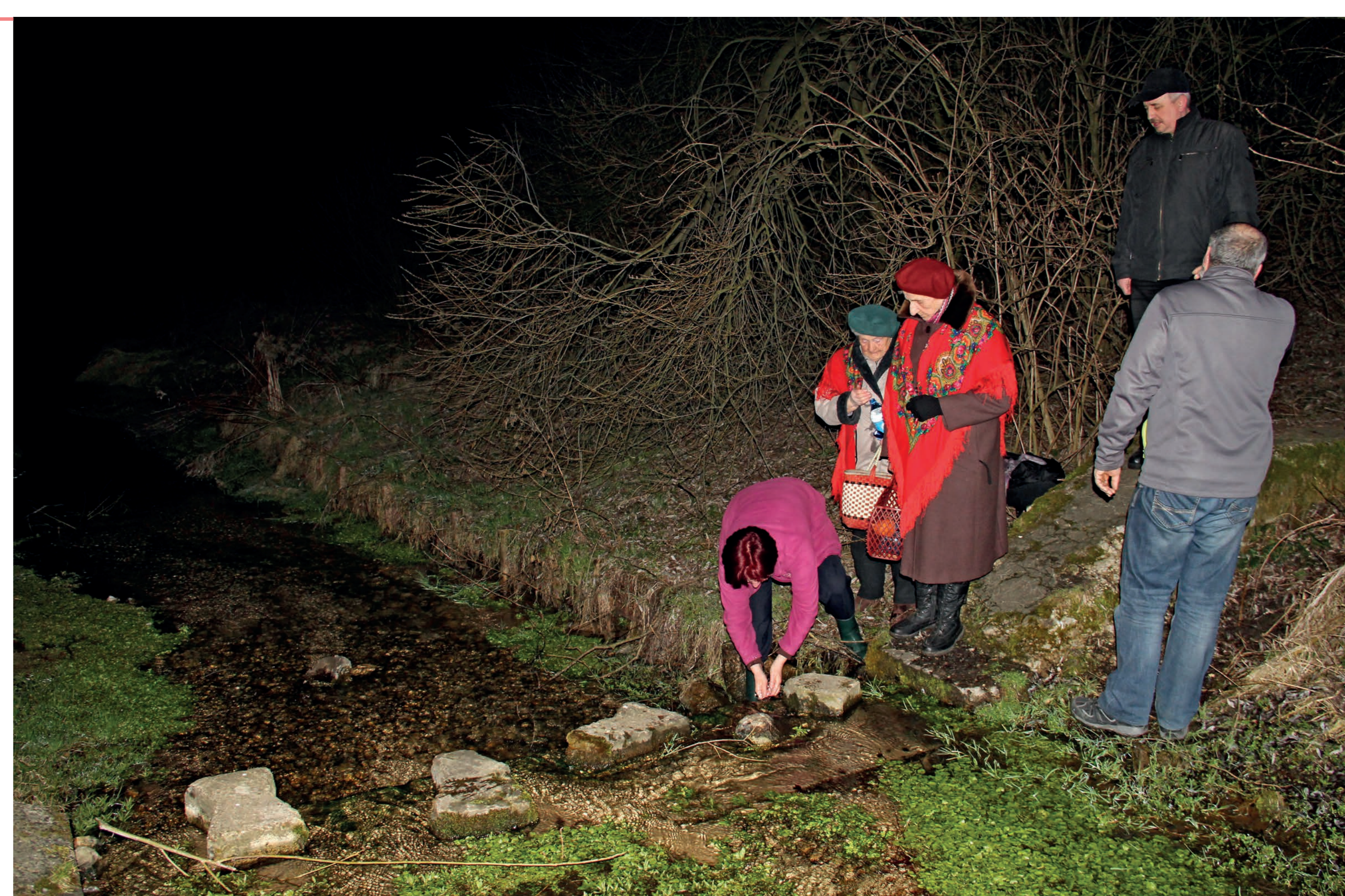
Nabieranie wody z potoku i obmywanie się nią. Pilica. 2016 r.