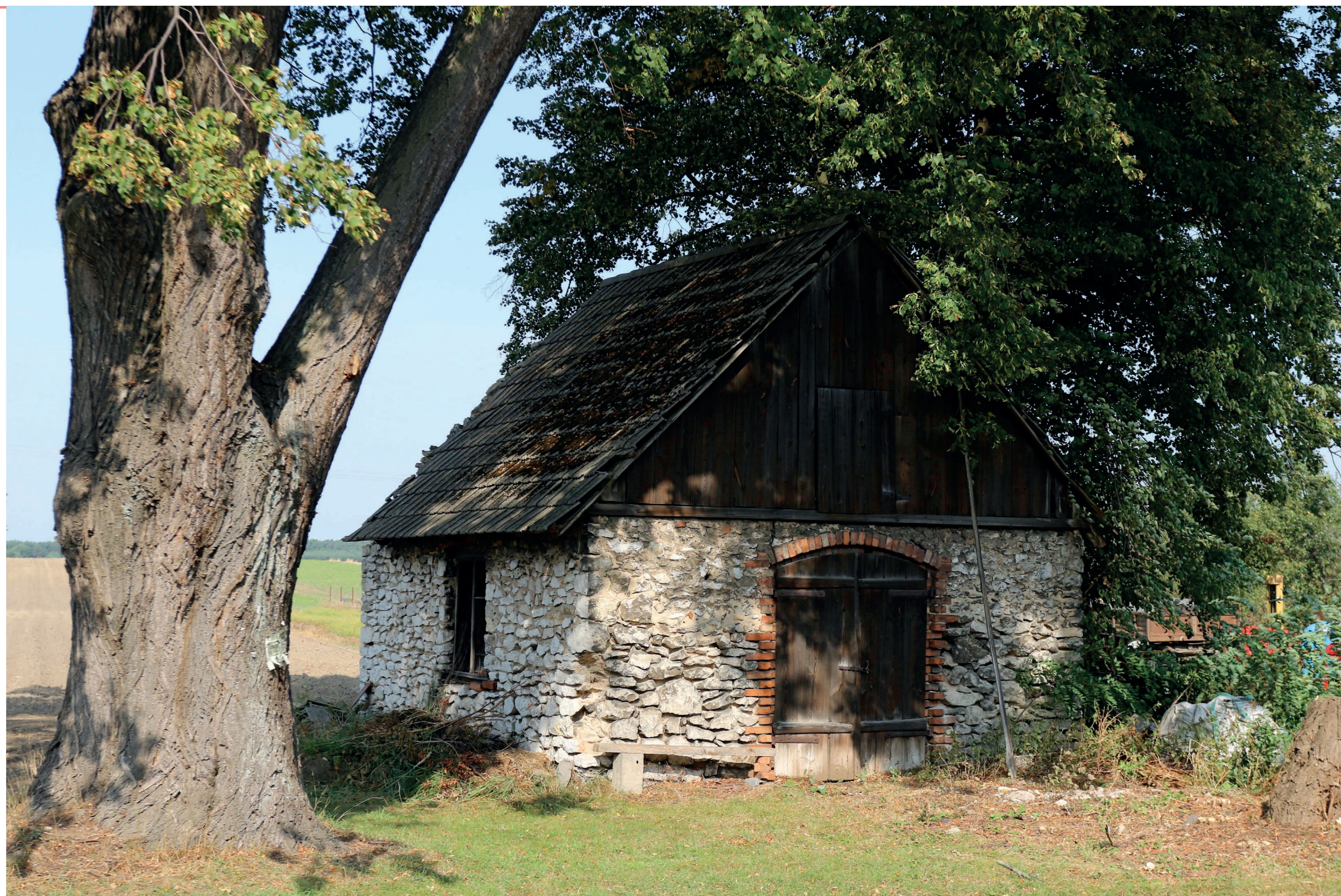
Dawna kuźnia. Rębelice Królewskie (gm. Popów). 2020 r.