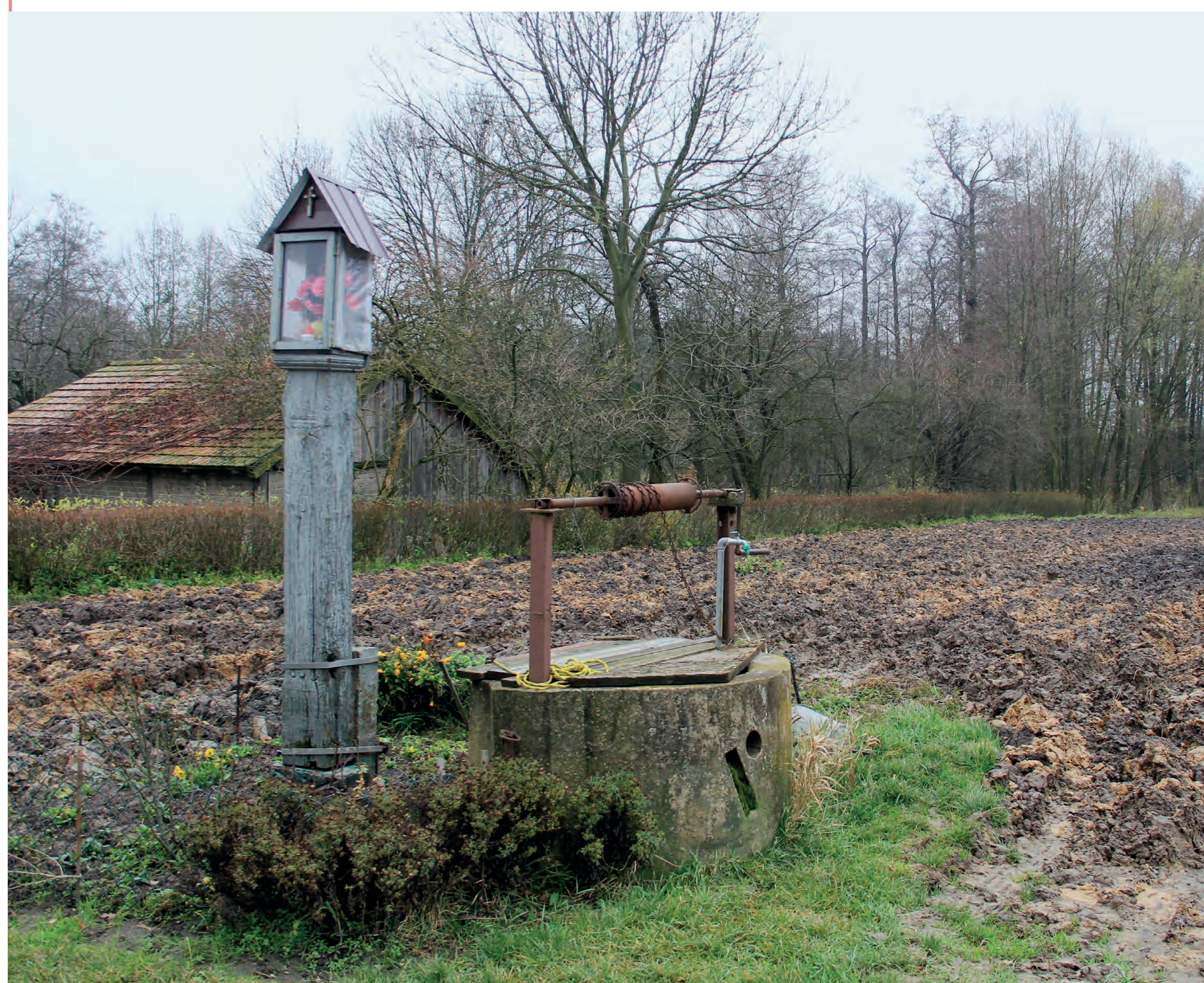
Kapliczka. Grabiec. 2017 r.