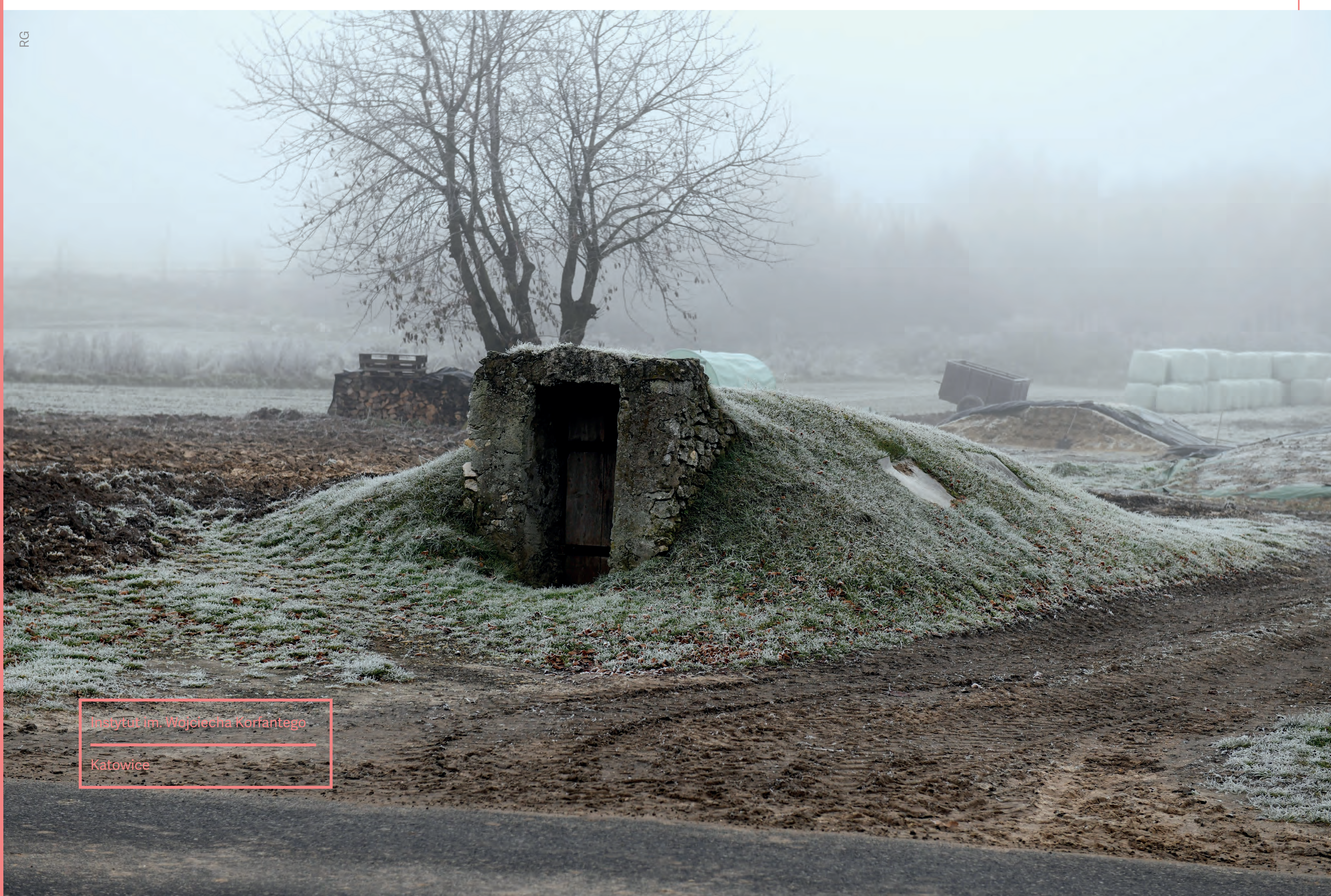
Ziemianka. Kleszczowa. 2022 r.