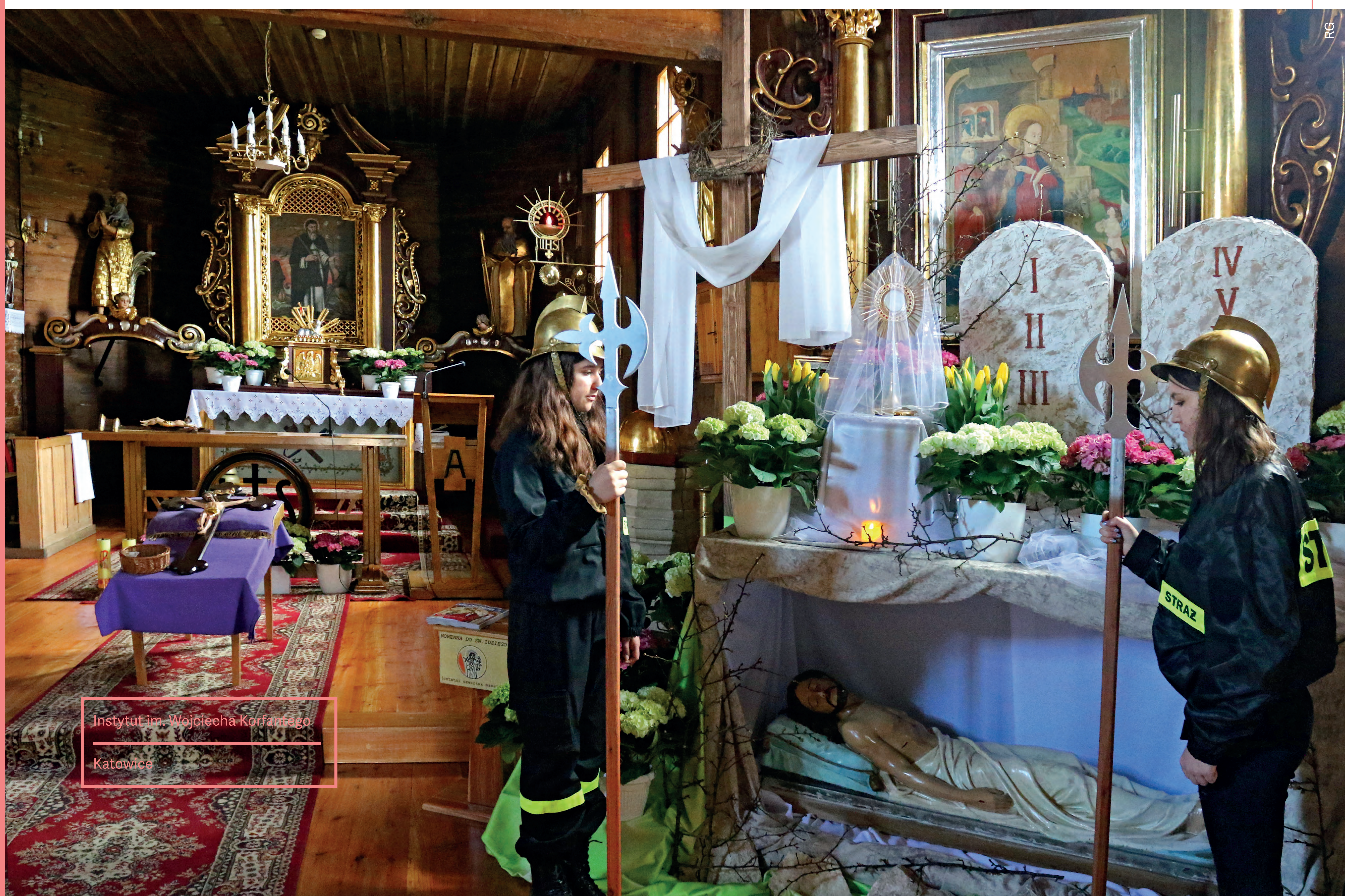
Żeńska warta przy grobie Pańskim. Zrębice. 2022 r.