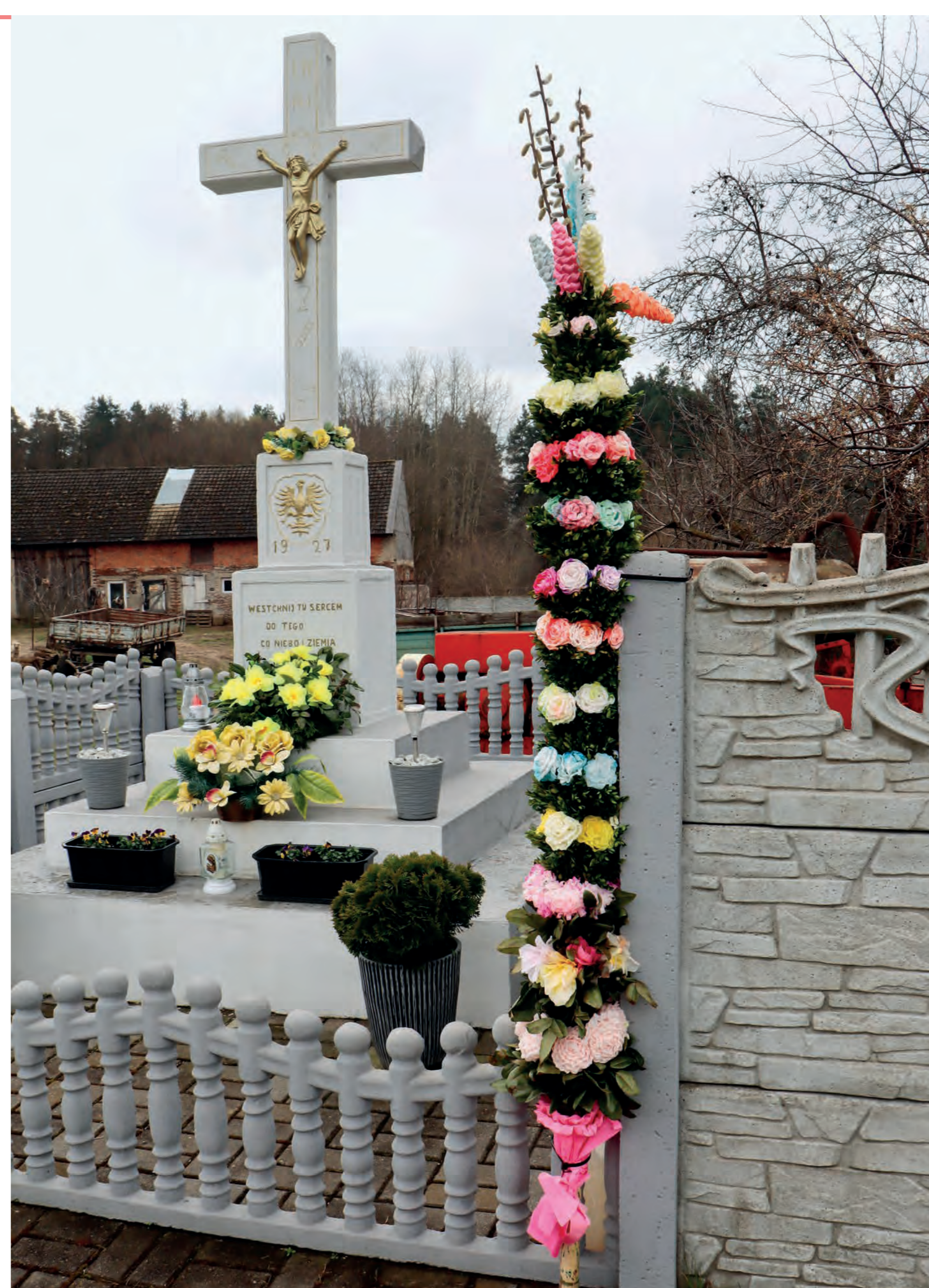
Palma ustawiona przy krzyżu przydrożnym. Nowa Kuźnica. 2023 r.