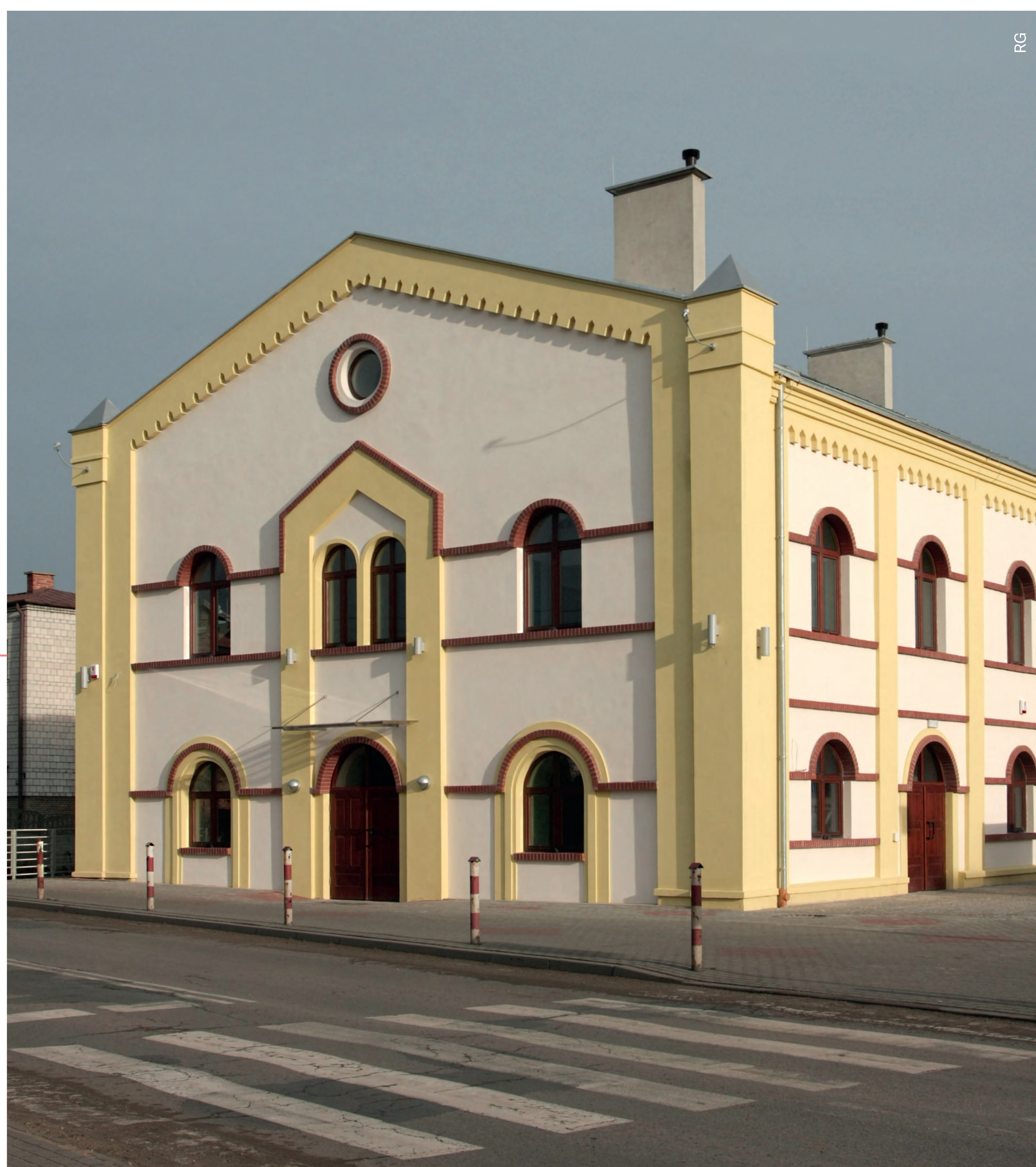
Budynek dawnej synagogi. Żarki. 2012 r.