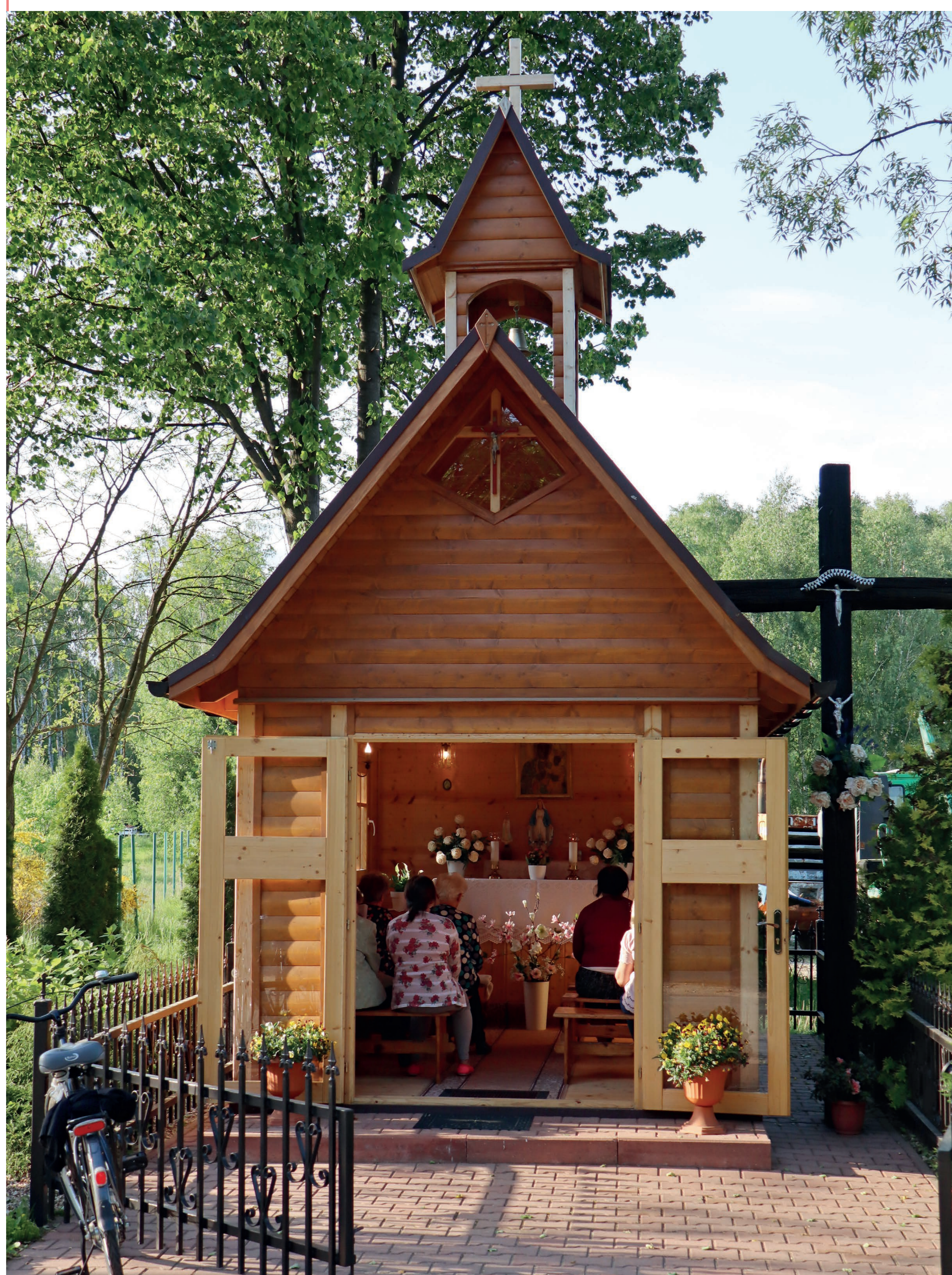
Nabożeństwo majowe. Okraglik. 2023 r.