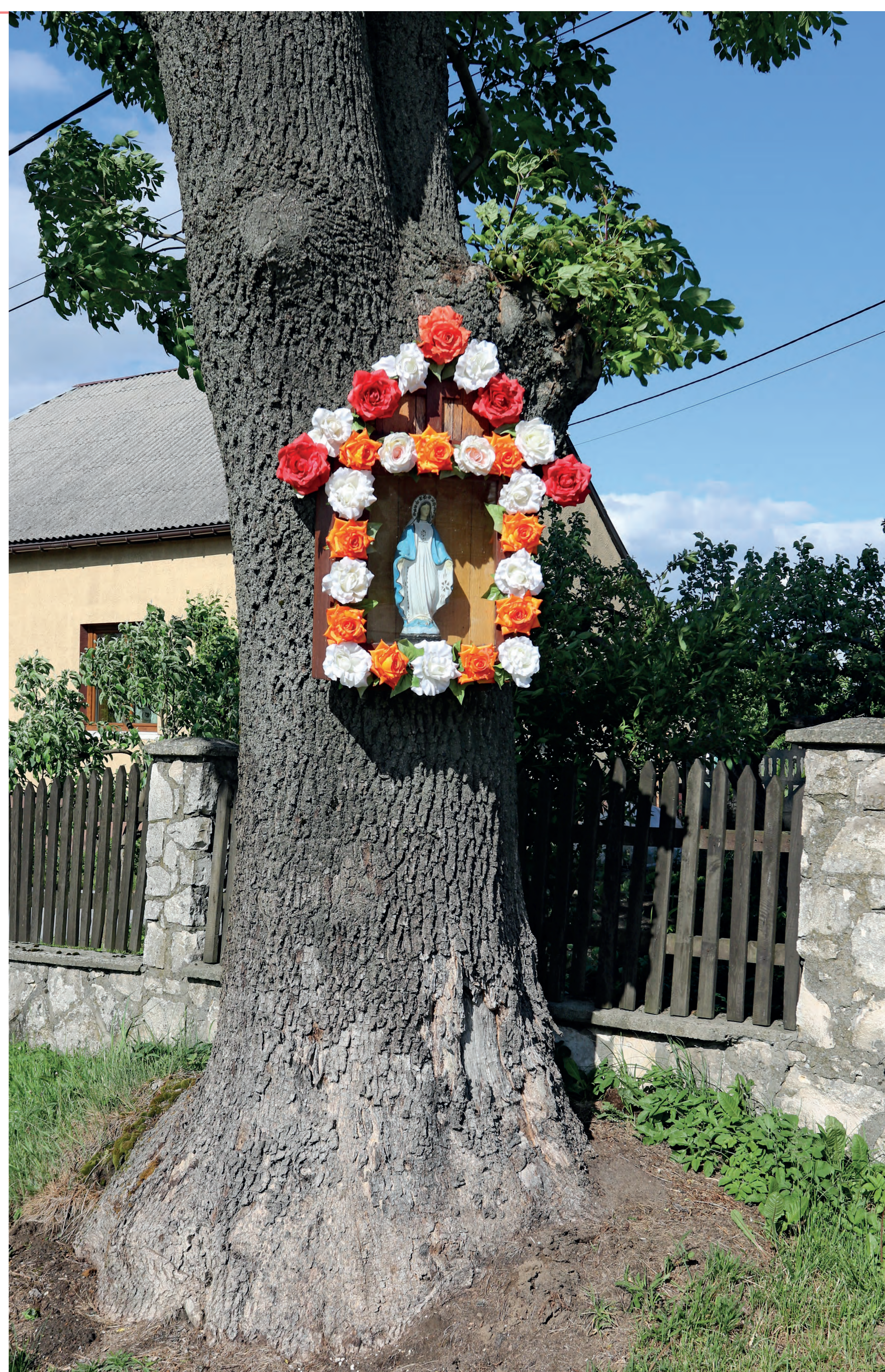
Kapliczka skrzynkowa. Kietkowice. 2022 r.