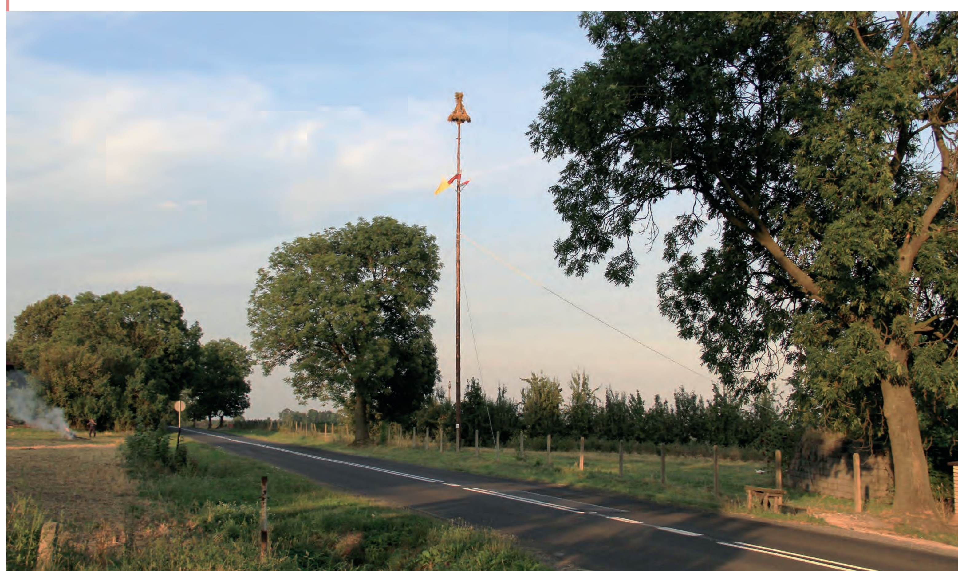
Ziele w pełnej okazałości. Ślężany. 2017 r.