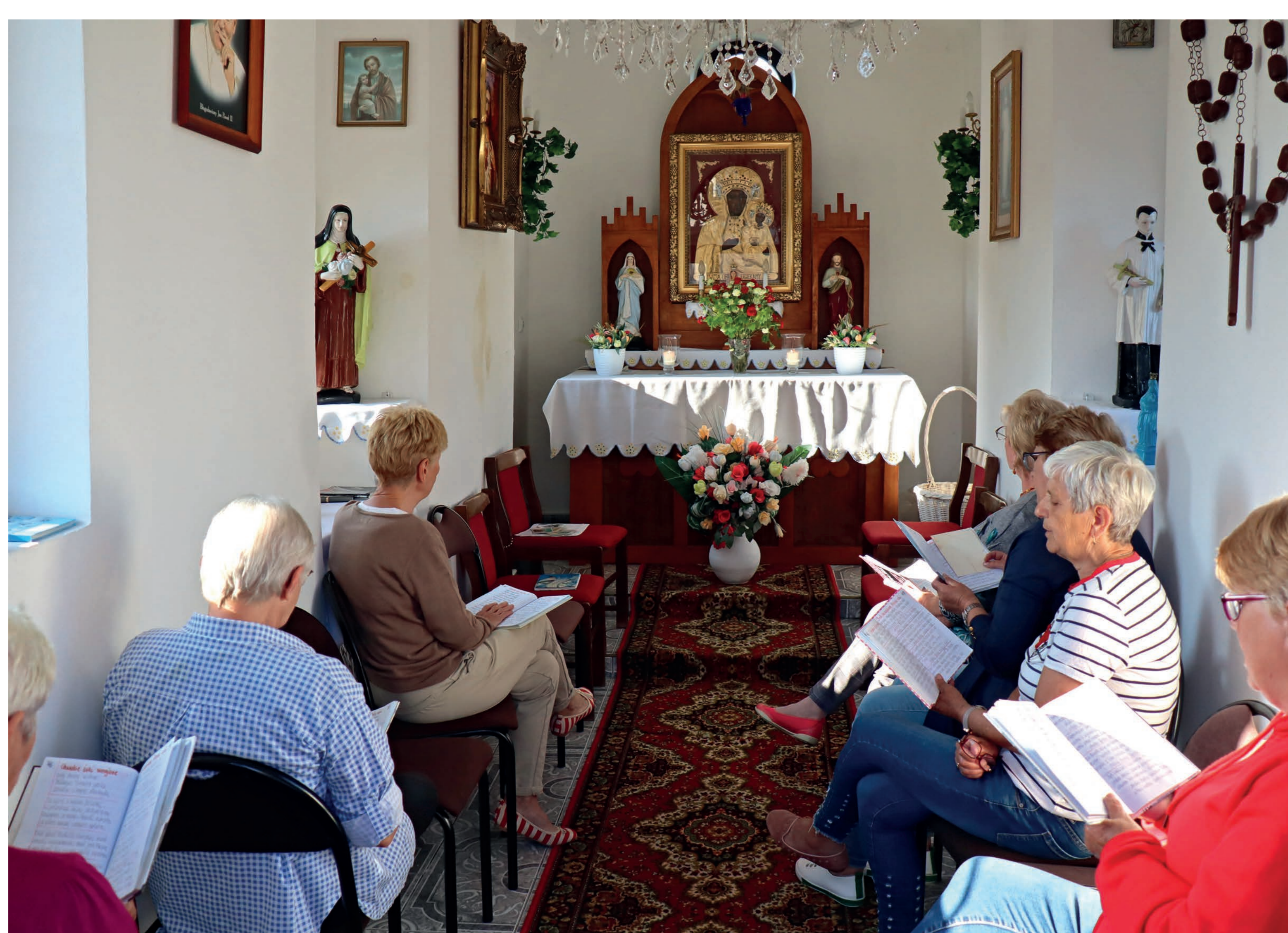
Nabożeństwo majowe. Lipnik. 2022 r.