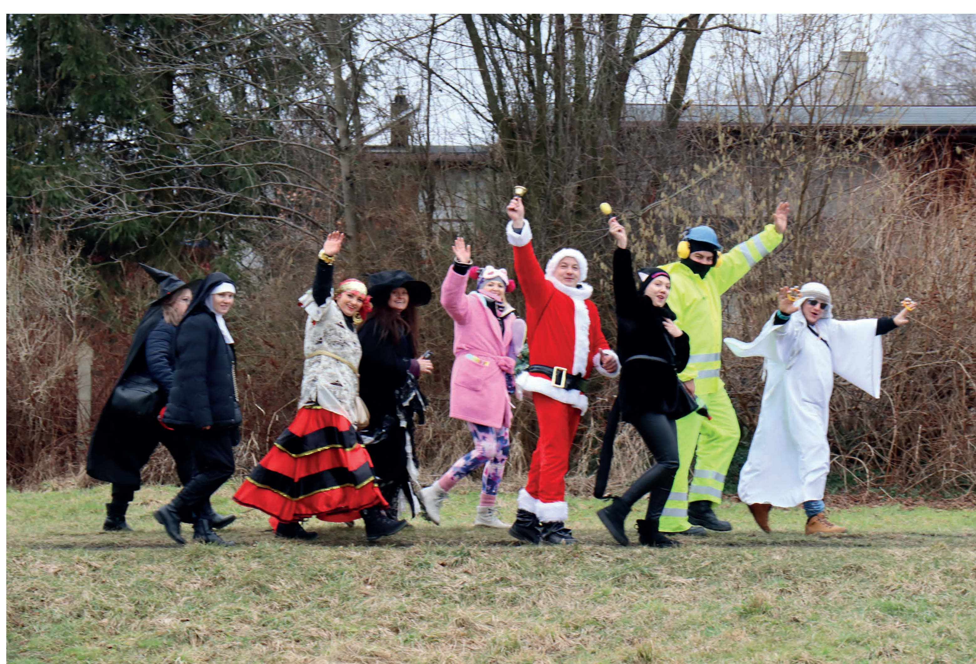
Grupa ostatekowa. Rększowice. 2023 r.