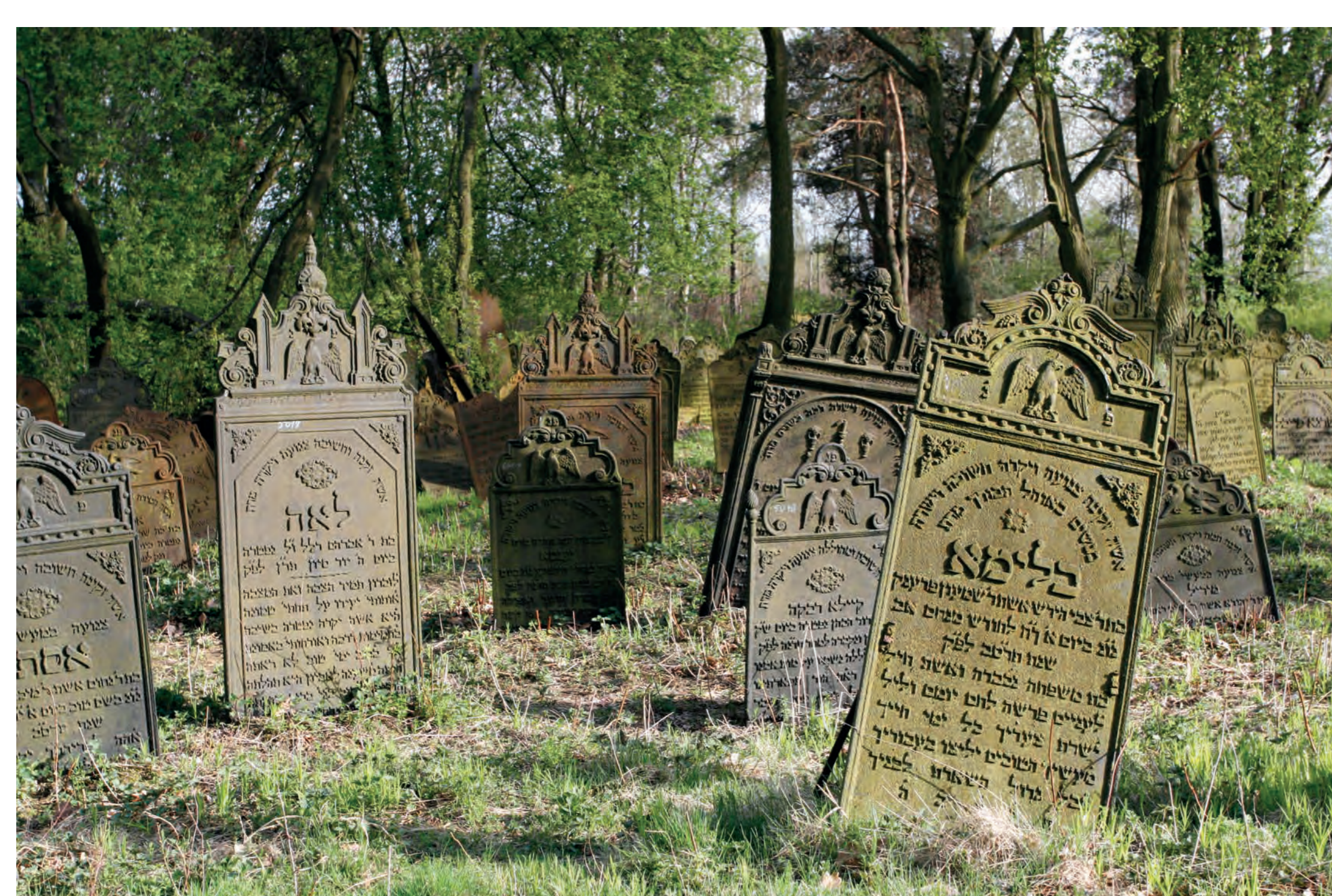
Żeliwne macewy na kirkucie. Krzepice. 2012 r.