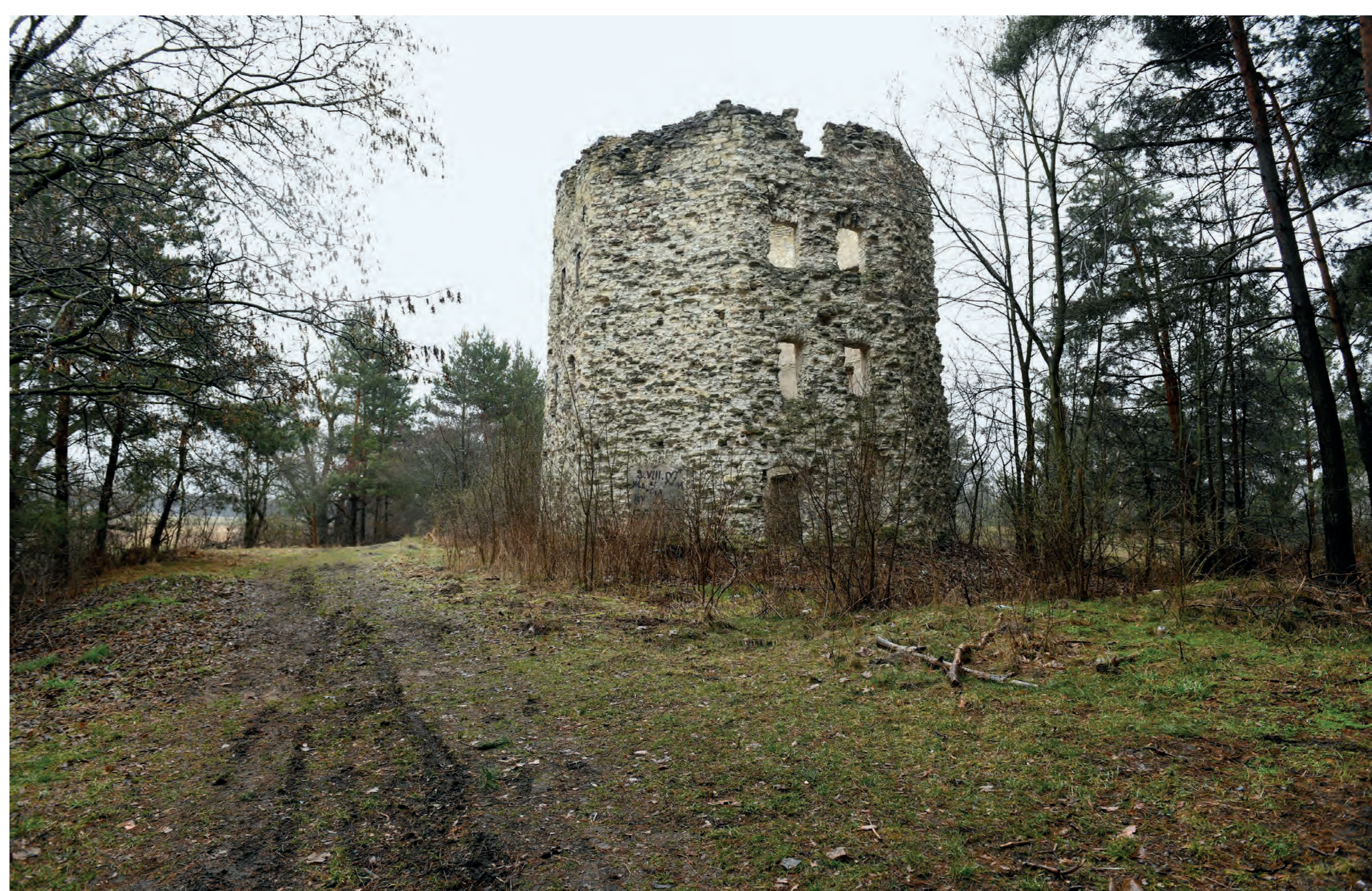
Ruiny młyna tzw. holendra. Soborzyce. 2023 r.