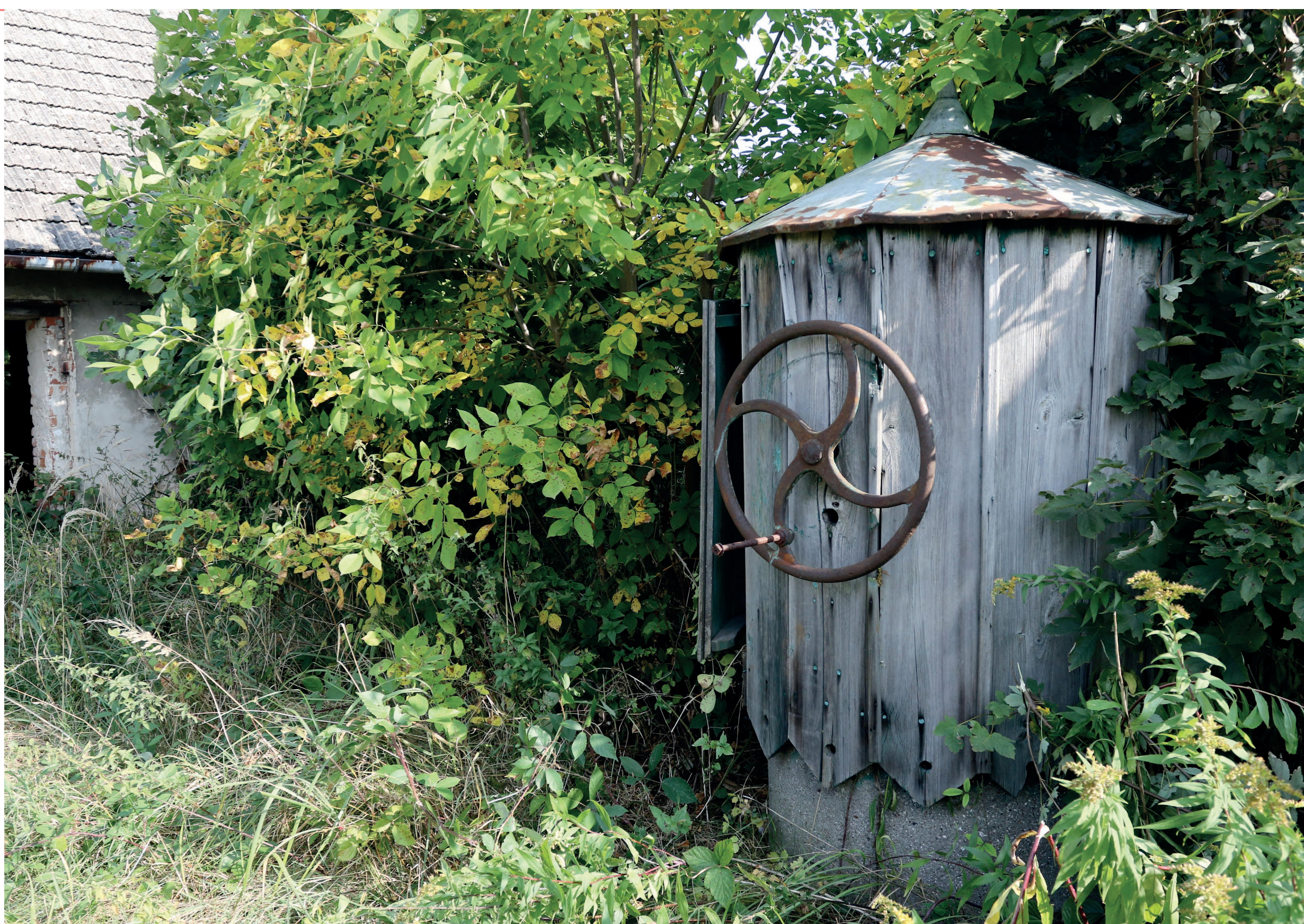
Studnia. Wilkowiecko. 2020 r.