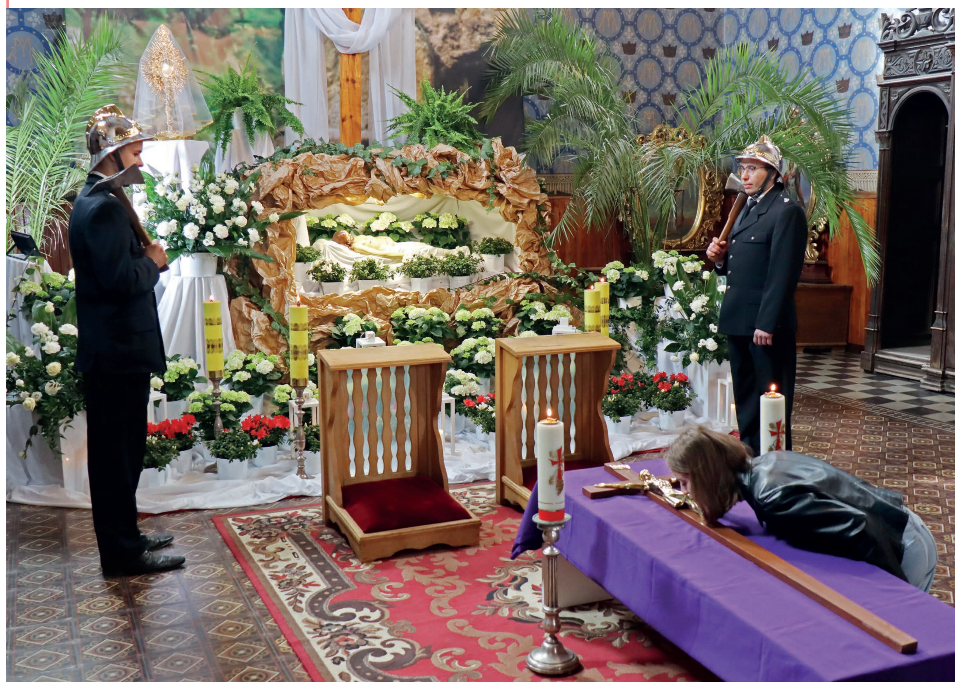
Strażacy przy grobie Pańskim. Irządze. 2022 r.