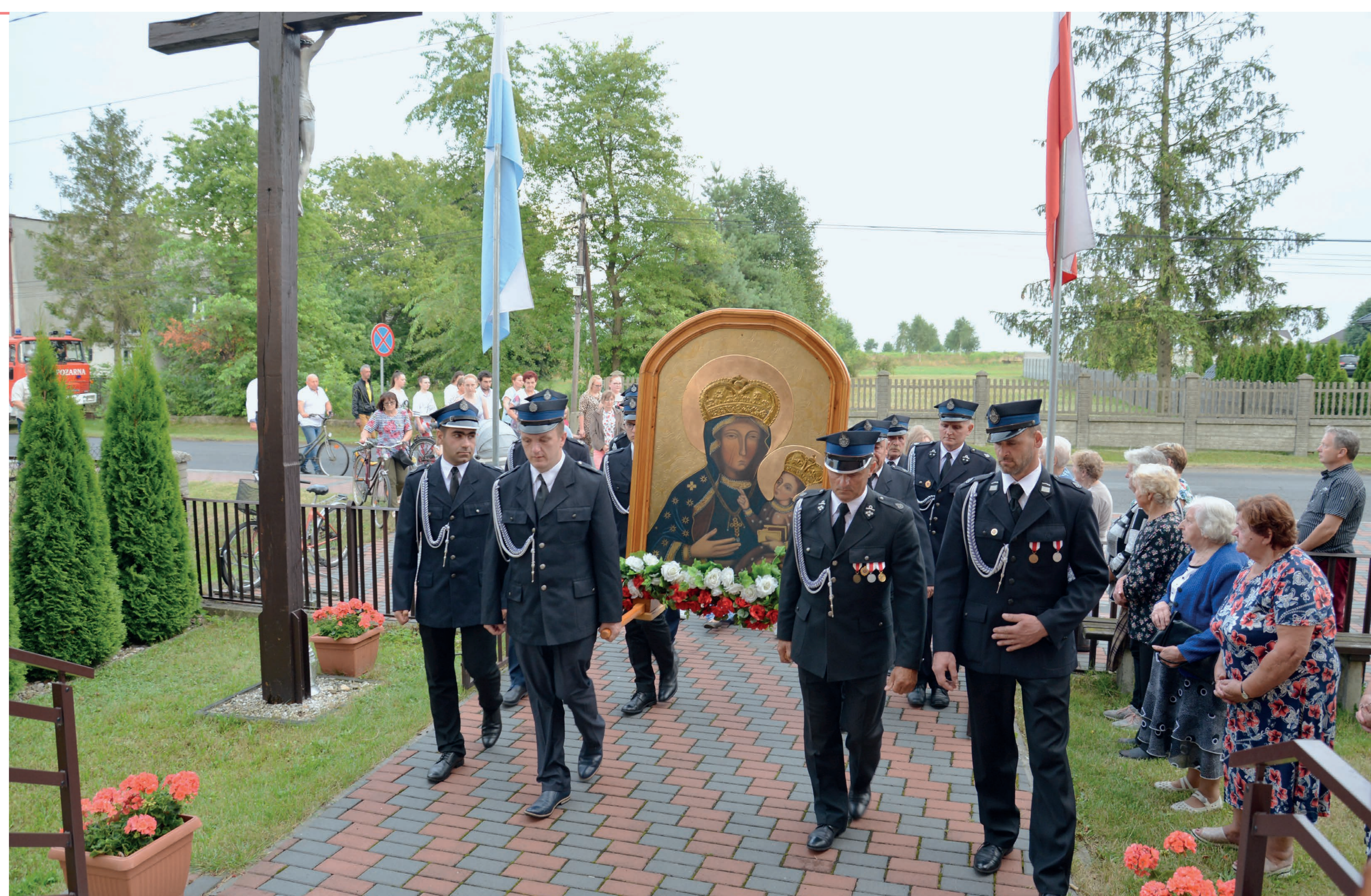
Pielgrzymi przed obrazem Matki Bożej Częstochowskiej. Częstochowa. 2022 r.