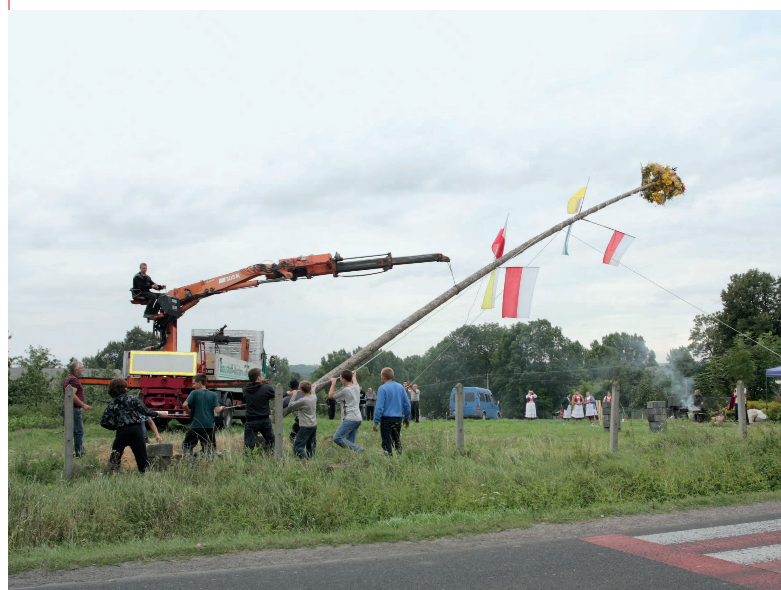
Podnoszenie ziela. Ślężany. 2012 r.