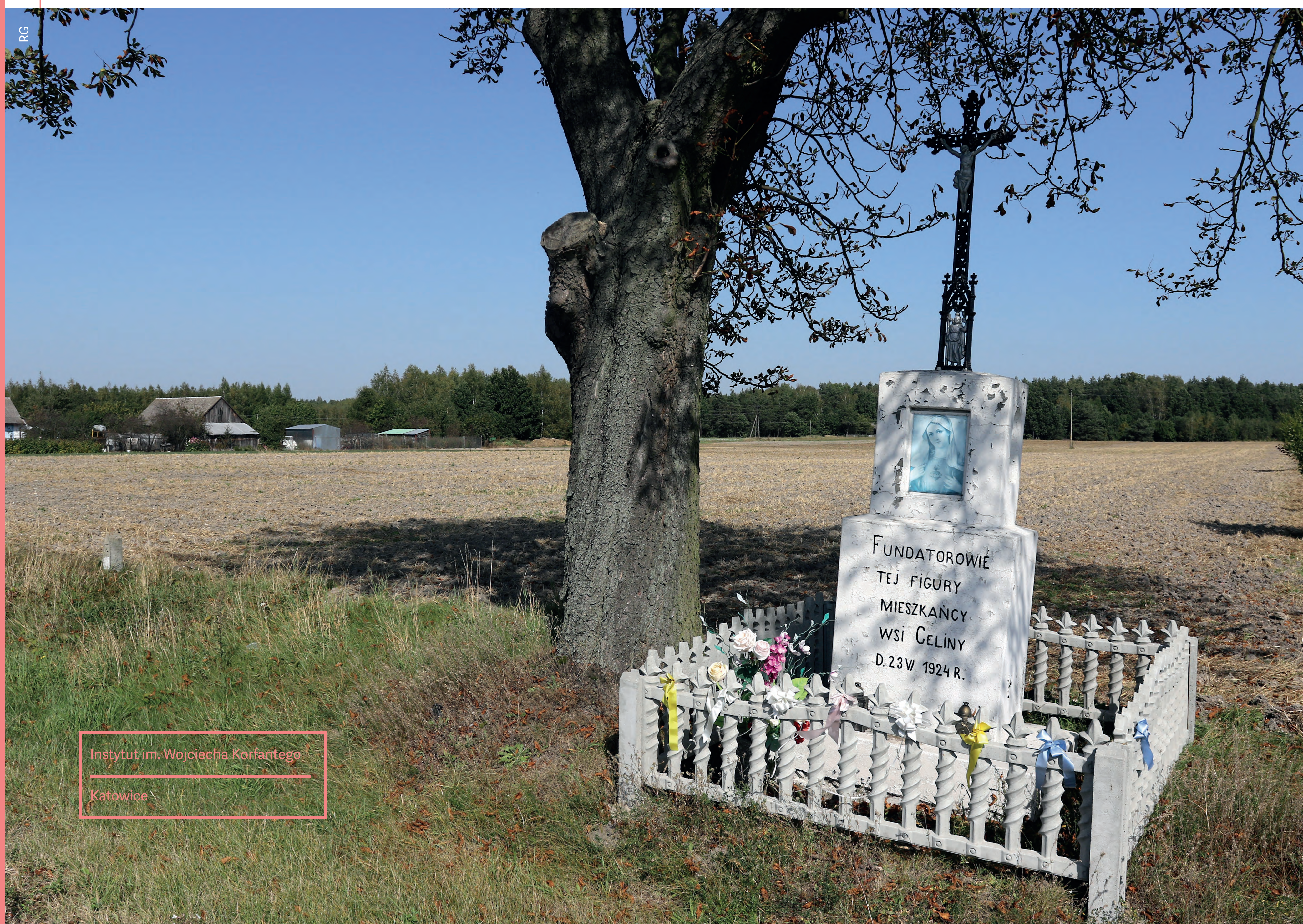
Kapliczka. Celiny. 2020 r.