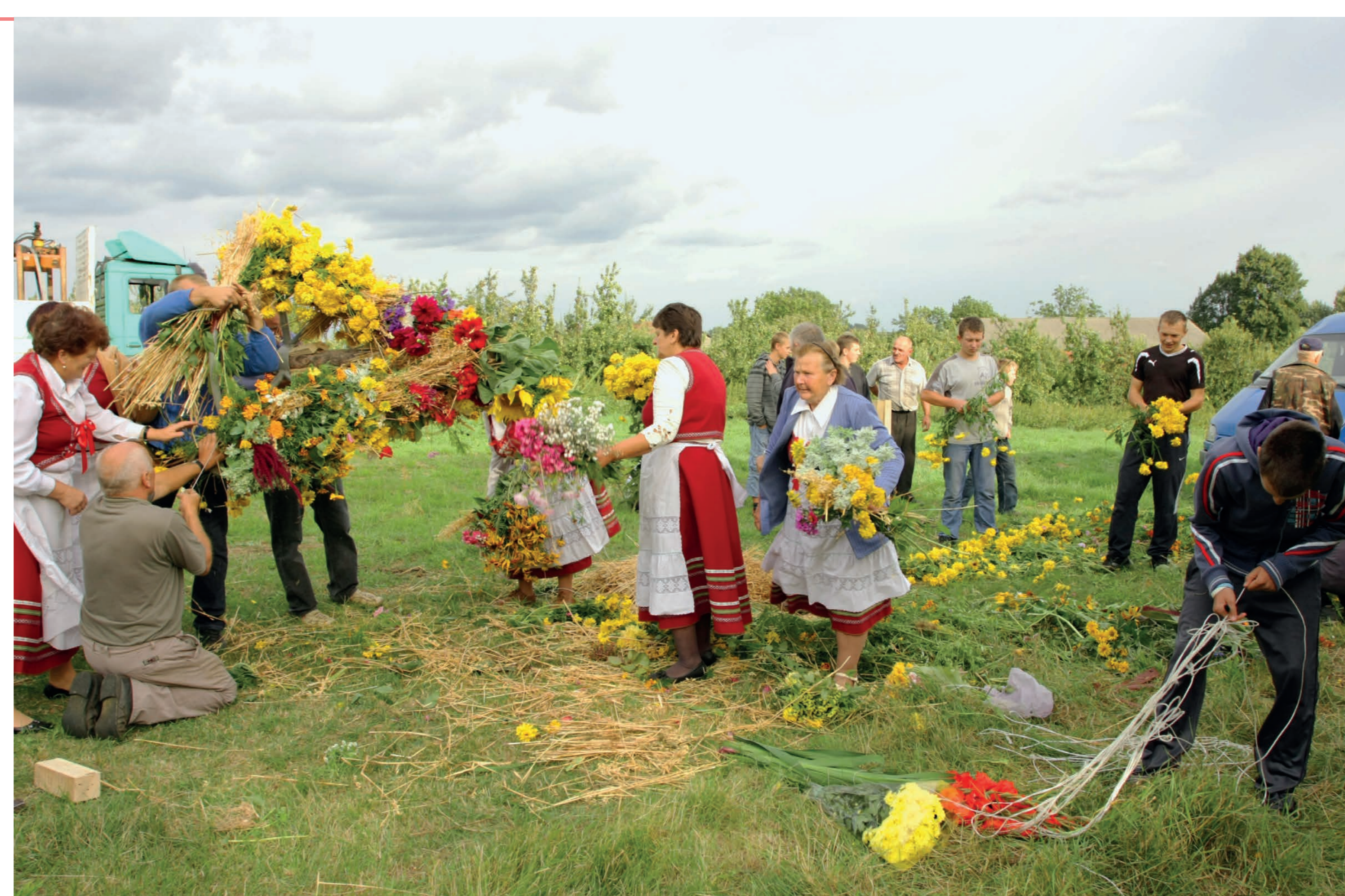
Mieszkańcy przygotowujący koronę zielną. Ślężany. 2012 r.