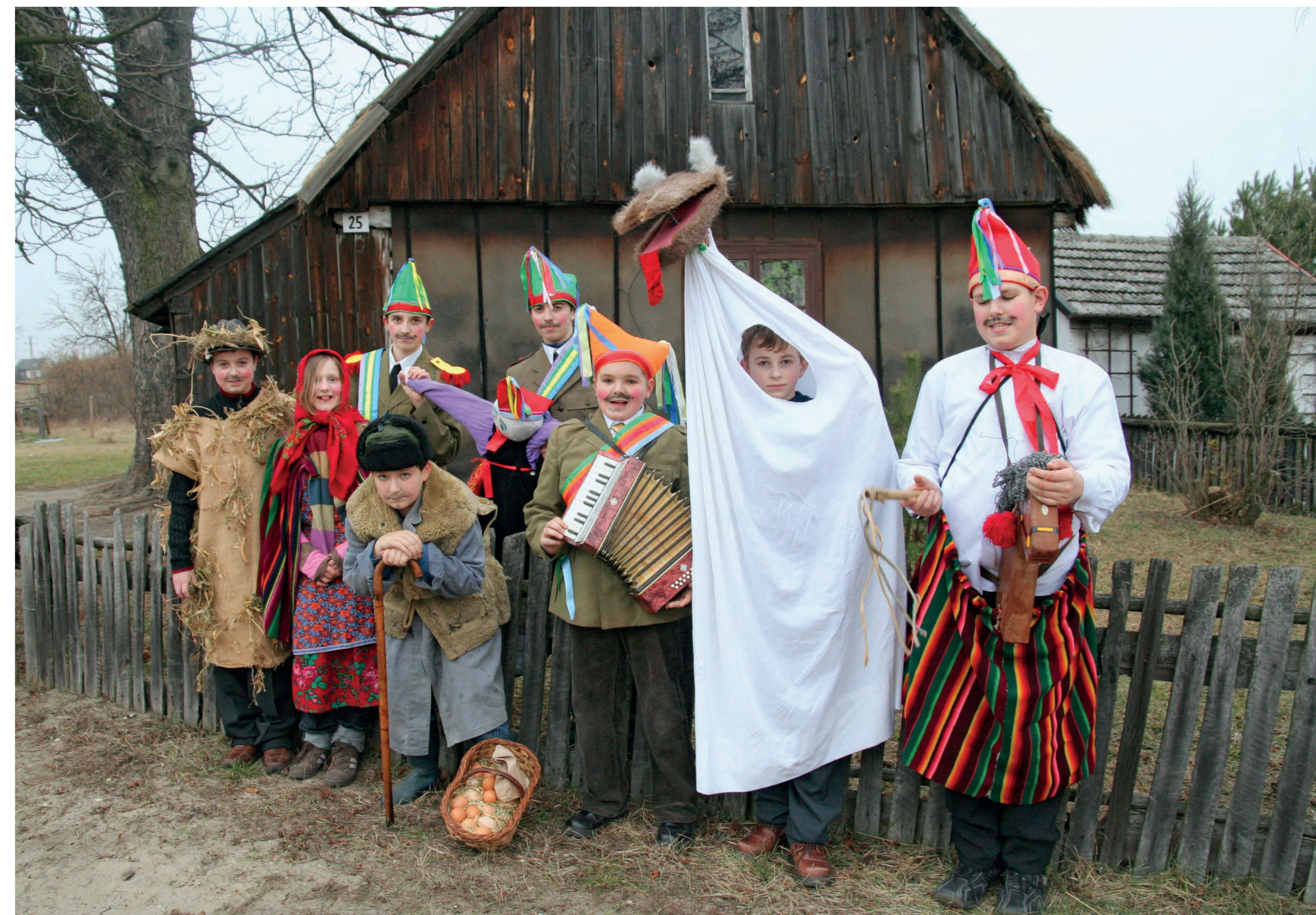
Misinki – grupa w pełnym składzie. Sygontka. 2008 r.