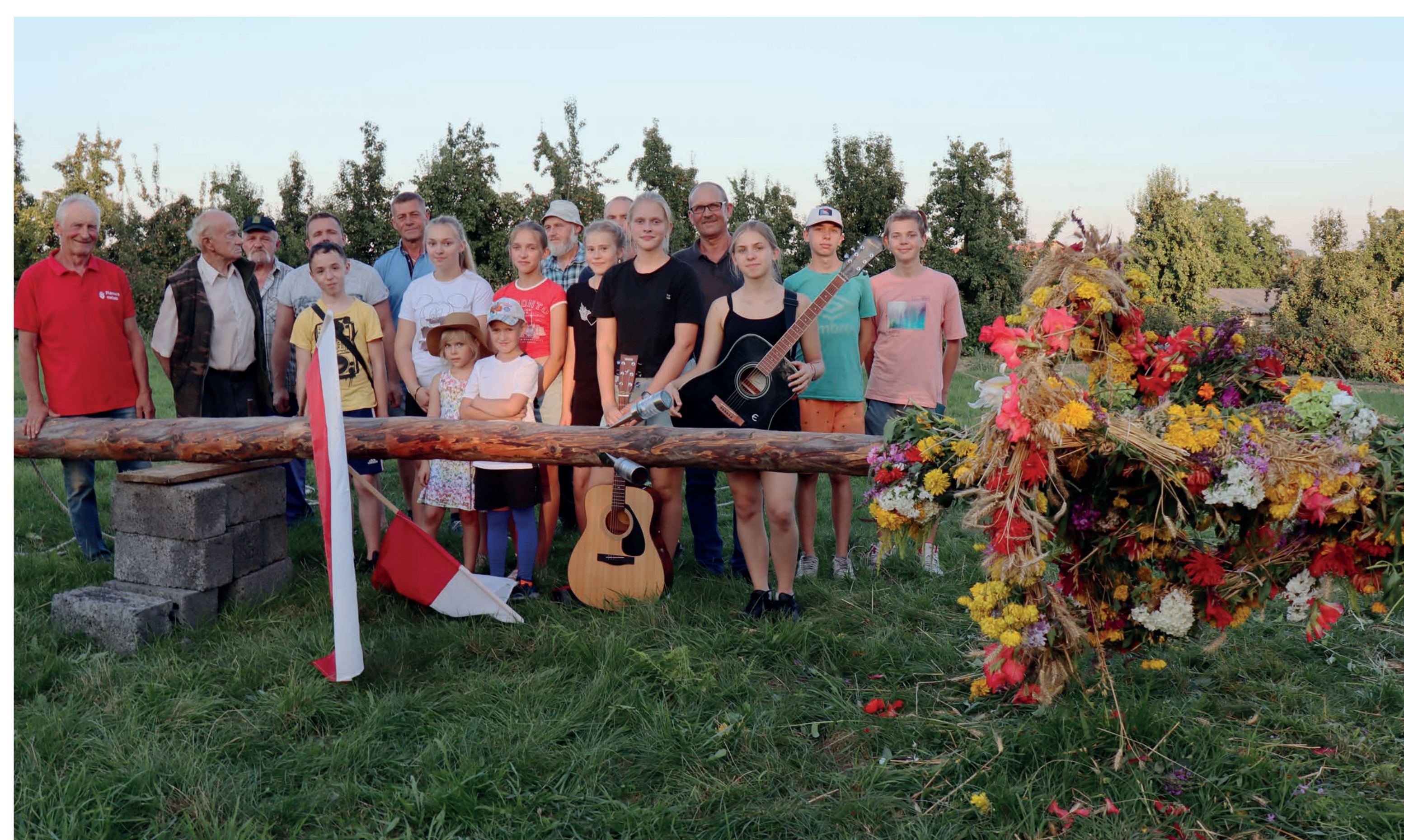
Mieszkańcy przy przystrojonym ziele. Ślężany. 2023 r.