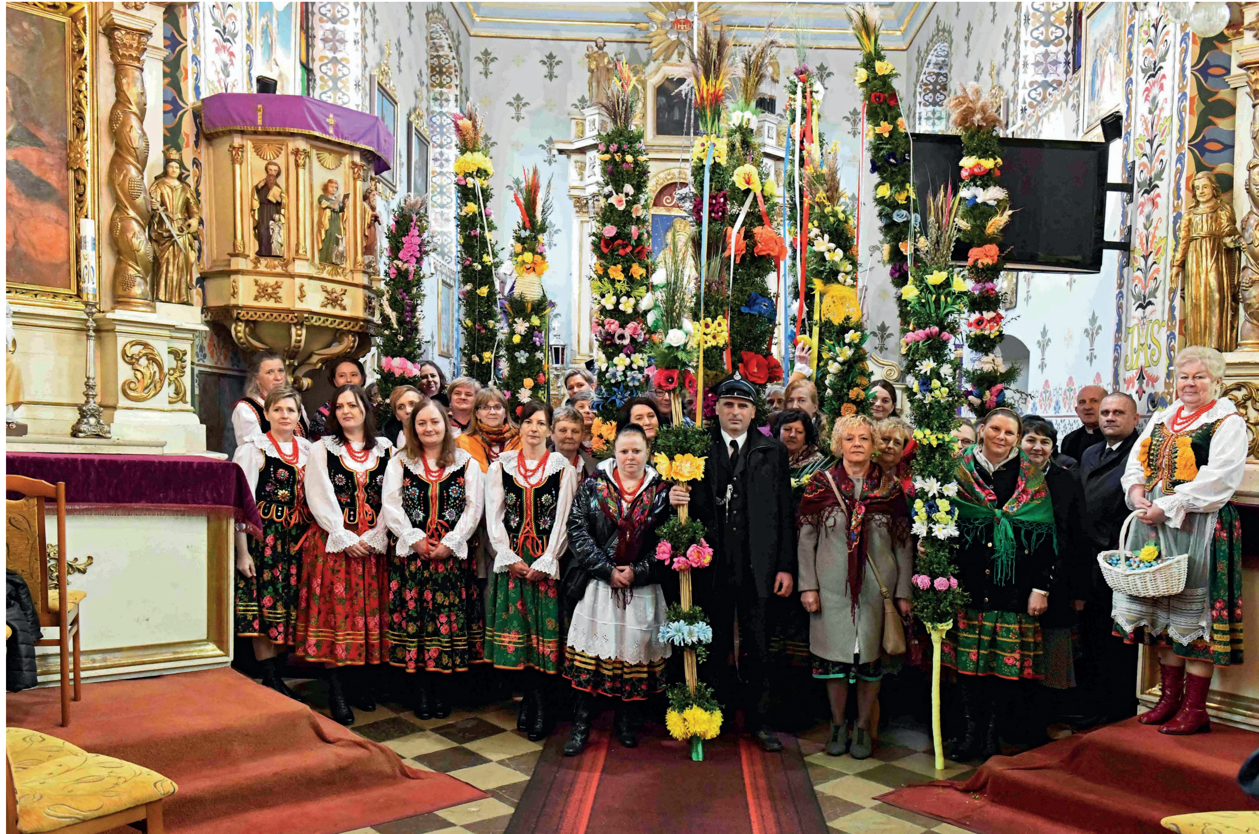
Uczestnicy nabożeństwa. Chlina. 2023 r.