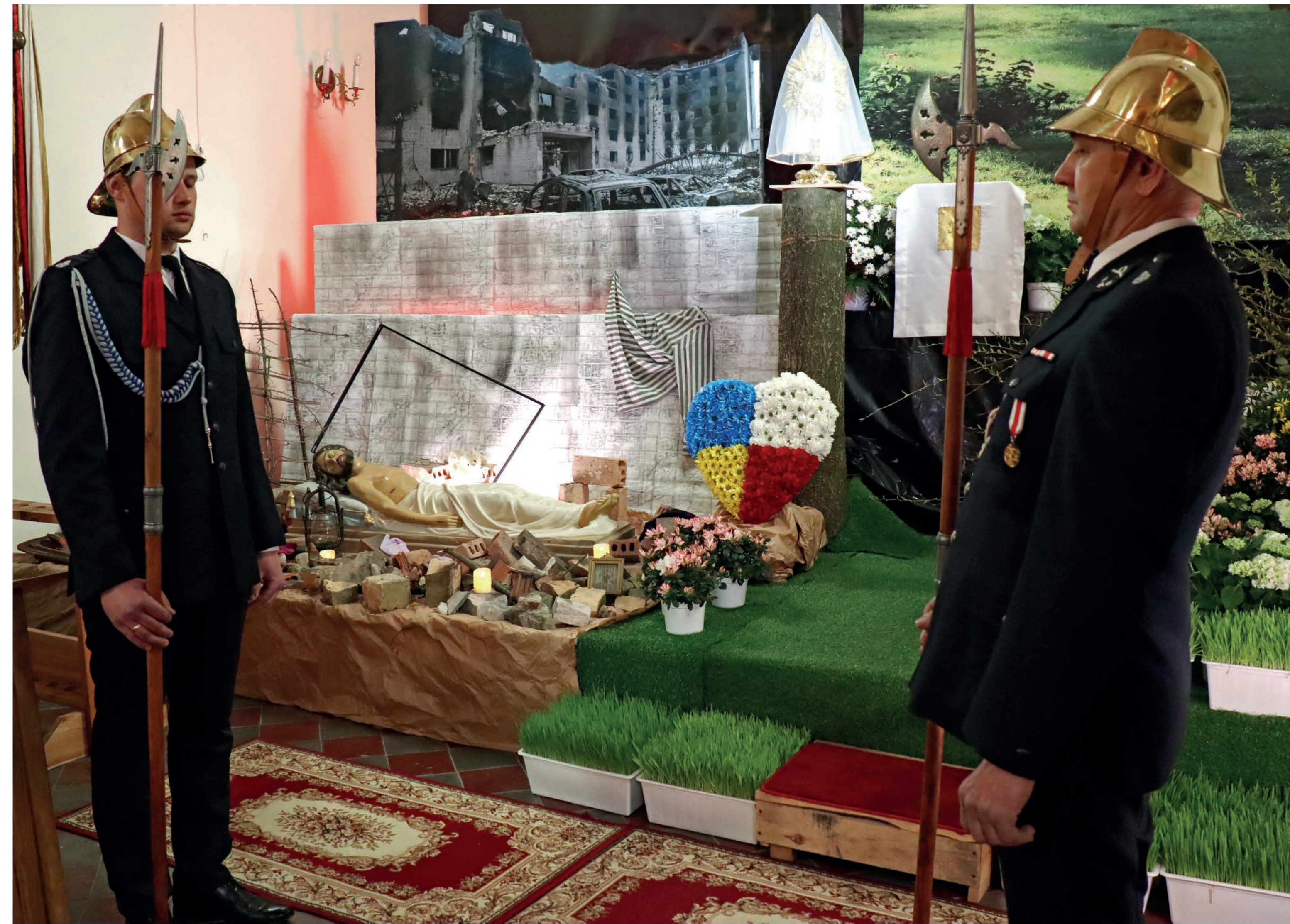
Strażacy przy grobie Pańskim. Jego wystrój odwołuje się do wojny w Ukrainie. Kidów. 2022 r.