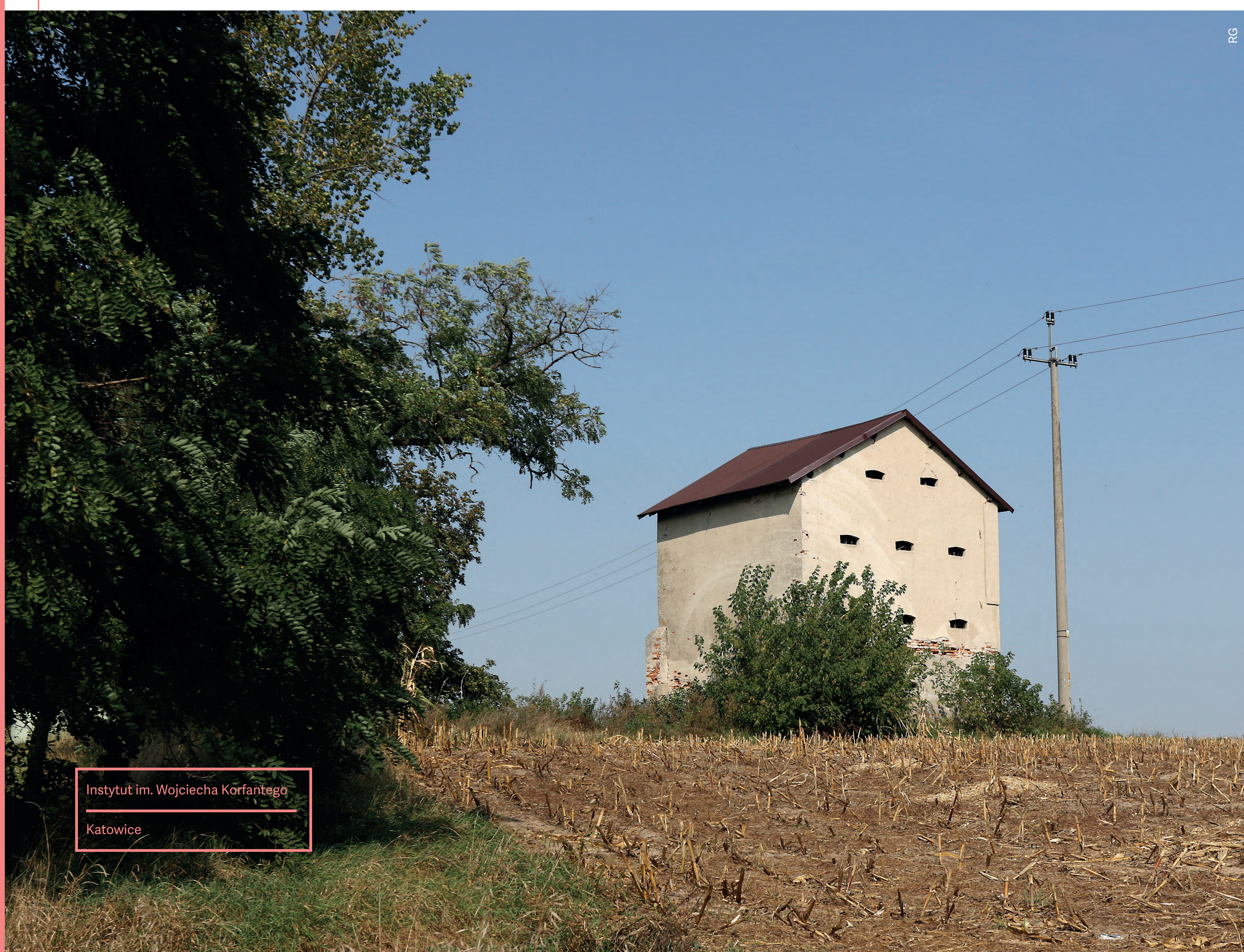
Spichlerz. Rębielice Szlacheckie. 2020 r.