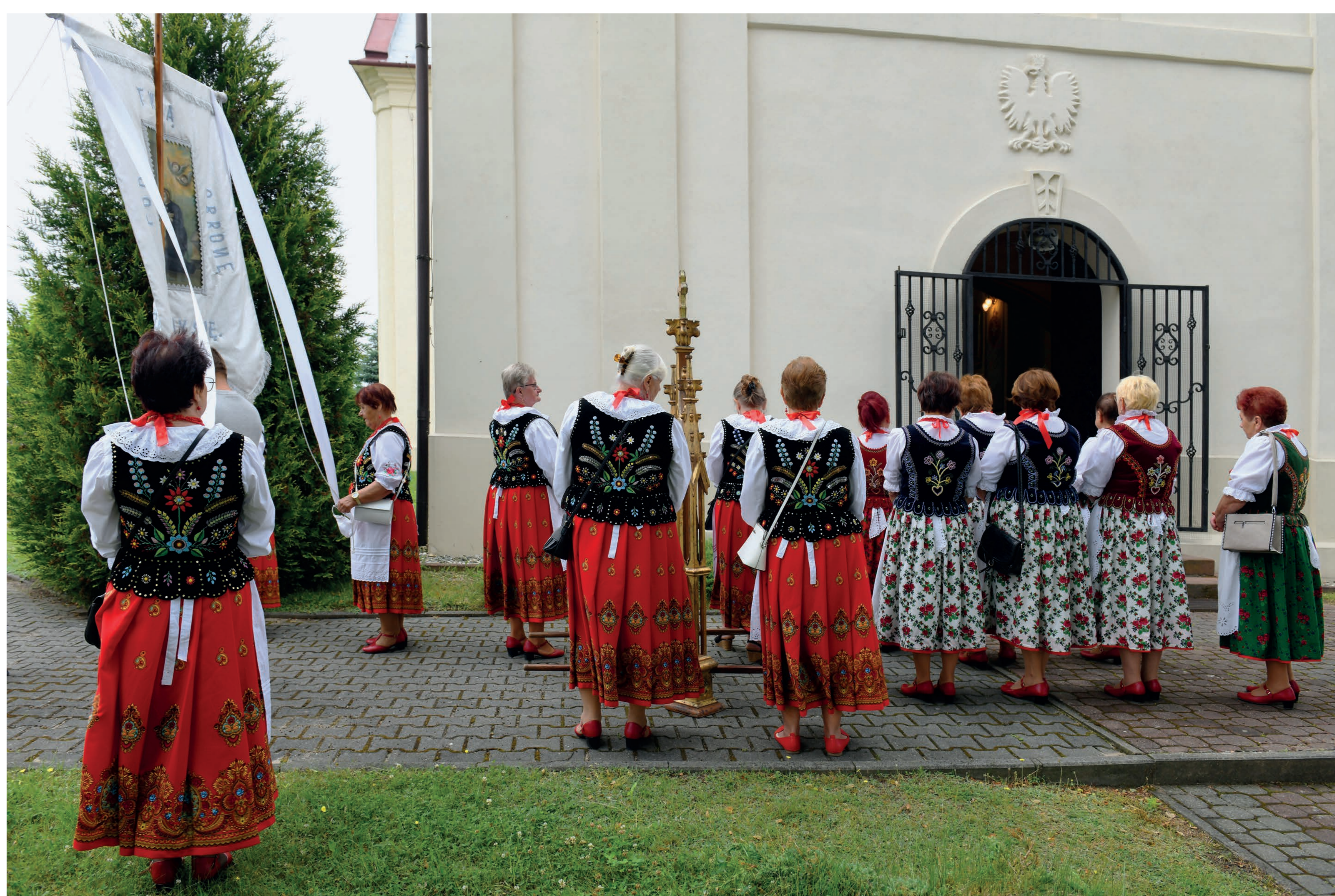
Członkinie KGW podczas mszy odpustowej. Przytyk Szlachecki. 2023 r.