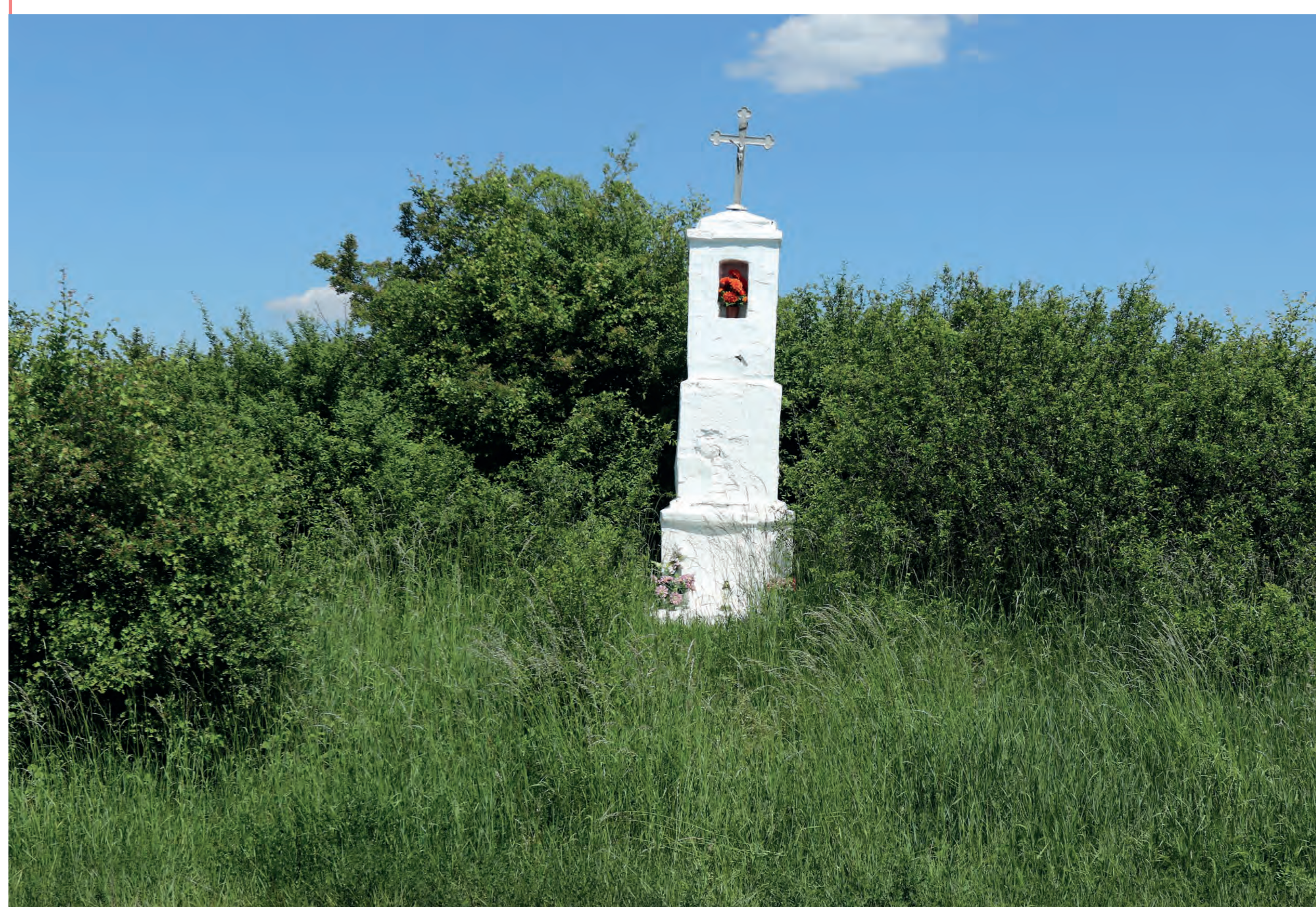
Kapliczka. Wysoka Lelowska. 2022 r.