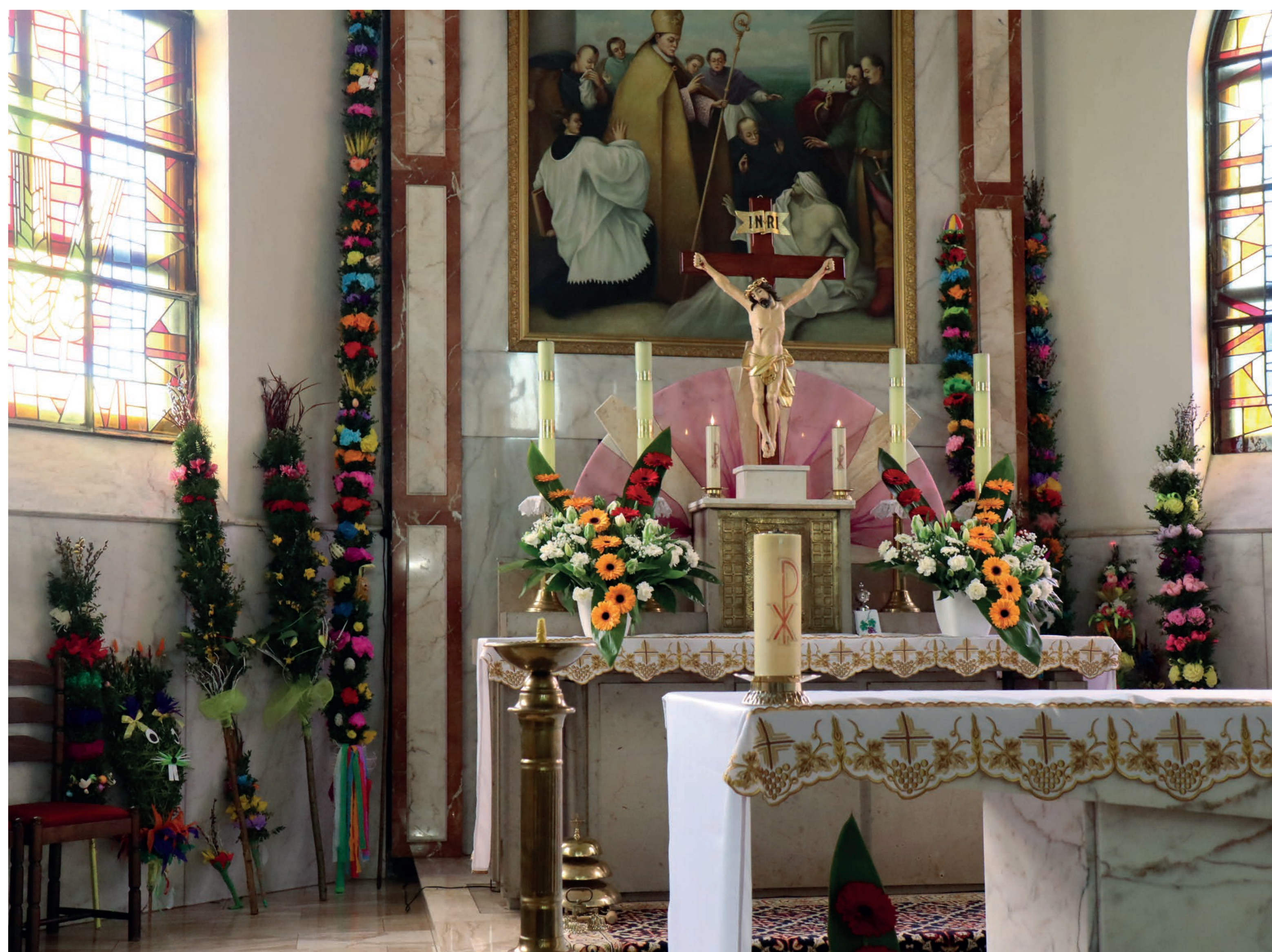
Palmy jako dekoracja ołtarza. Stary Cykarzew. 2023 r.