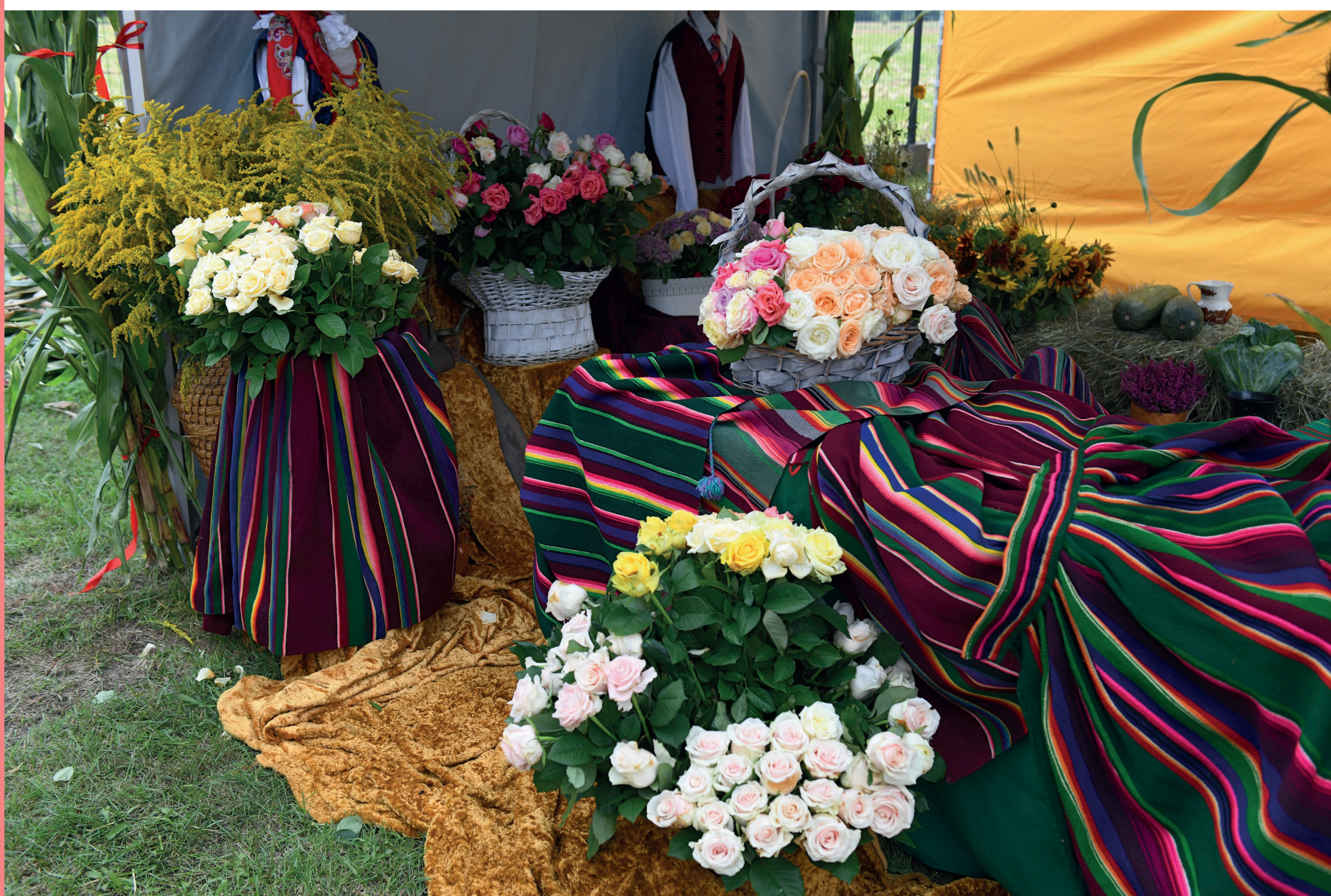
Zapaski naramienne stanowiące wystrój jednego ze stoisk dożynkowych. Podlesie (gm. Lelów). 2022 r.