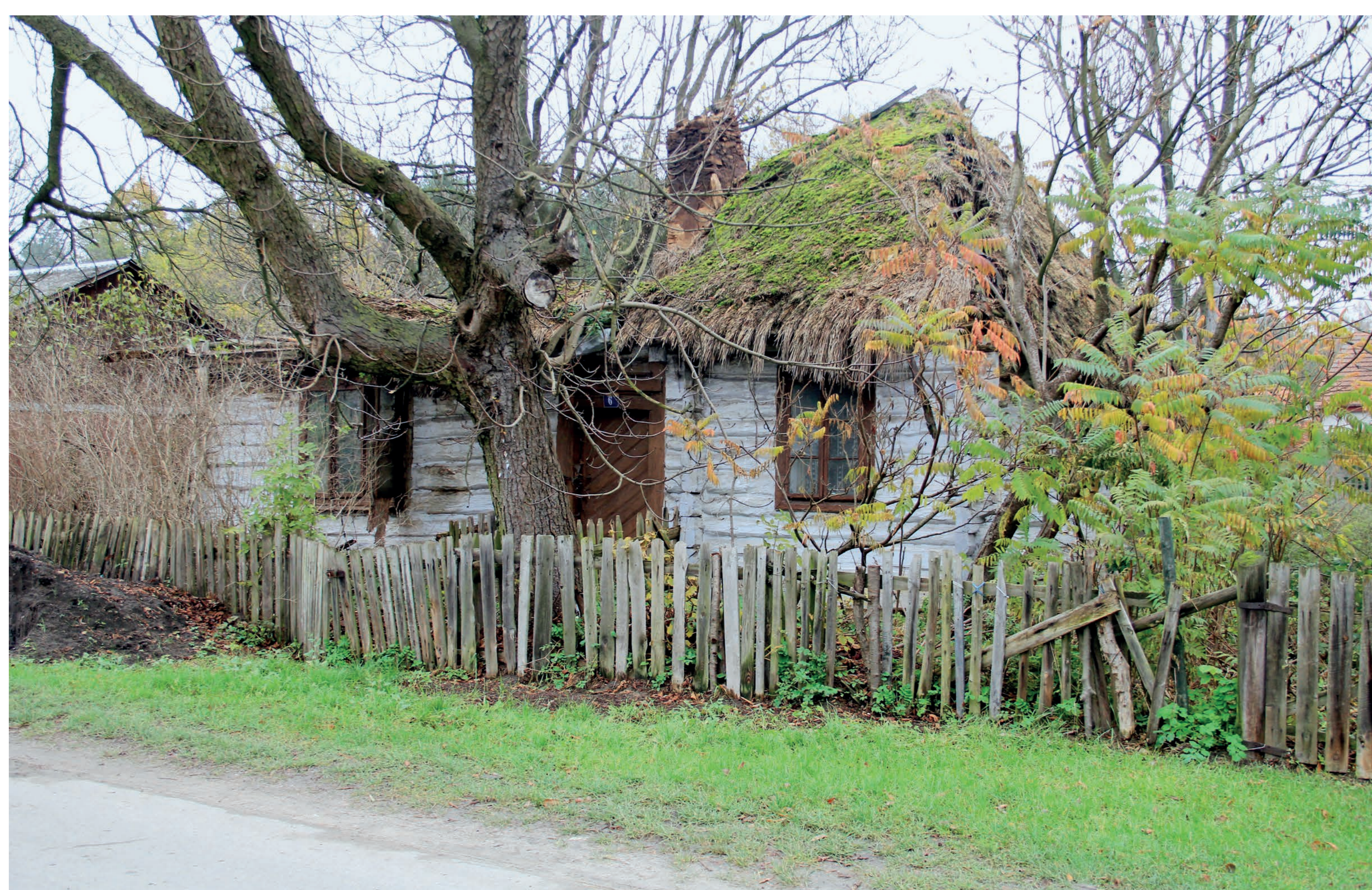
Ruiny chaty krytej strzechą. Rokitno. 2017 r.